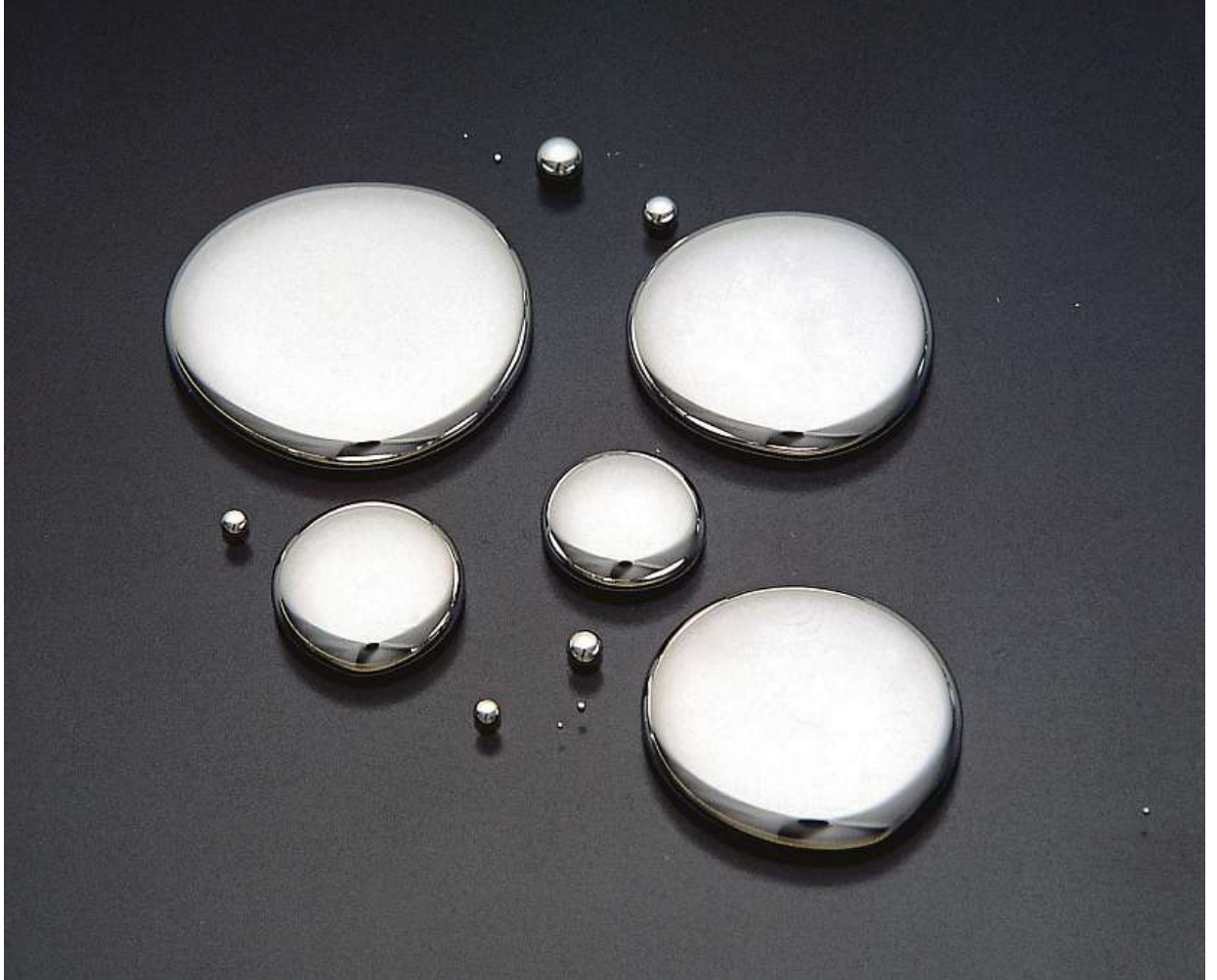
Rtuť je jediný kov, který je kapalný za pokojové teploty. Jedná se o materiál s vysokou hustotou.

„Když v novinách čtete o tom, že elektrárna vypustila pár set kilogramů rtuti, jde o nic neříkající sumu za celý rok. V jednom kubiku spalin jsou řádově desítky mikrogramů této látky. Zásadním zdrojem rtuti v ovzduší jsou však i přirození přírodní procesy.