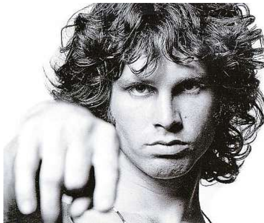
Nespoutaný Jim Morrison pózuje na fotografii známé jako Young Lion, mladý lev.

Syn Jim vynikal bystrou hlavou, na Kalifornské univerzitě si vybral filmovou školu, skvěle prospíval, pokusil se o několik experimentálních krátkých snímků. „Jakoli byl sečtělý a přemýšlivý intelektuál, navenek si liboval v přezíravých pózách a hrané lhostejnosti,“ říkal o něm jeho kumpán z The Doors Ray Manzarek. Krásným důkazem byla vlastní promoce, kterou zcela ignoroval,