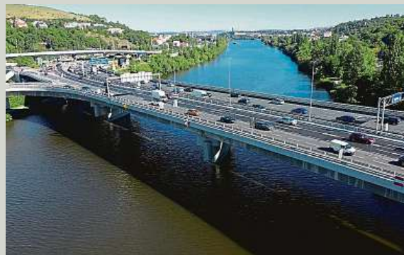
Práce na horní části mostu skončily letos v září. Dokončovací práce pak pokračovaly pod konstrukcí a na březích Vltavy.

na pravém břehu. Pojmenován je podle Barrandova, respektive přilehlé Barrandovské skály a navazující komunikace K Barrandovu.