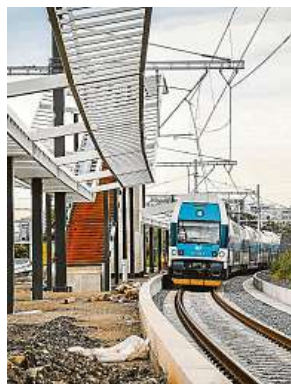
Stavba nové vlakové zastávky Rajská zahrada ROPID