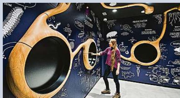
Moderní návštěvnícké středisko Dům přírody Bílých Karpat ve Veselí nad Moravou

Na jaře zavítají návštěvníci do Domu přírody Bílých Karpat ve Veselí nad Moravou. Podporu na jeho vybudování navýšil Jihomoravský kraj. Dům Bílých Karpat chce příťažlivou formou seznámit veřejnost s přírodními zajímavostmi tohoto území. Budou tu expozice celosvětově proslulých luk s pestrou škálou orchidejí a motýlů i další. ČTK