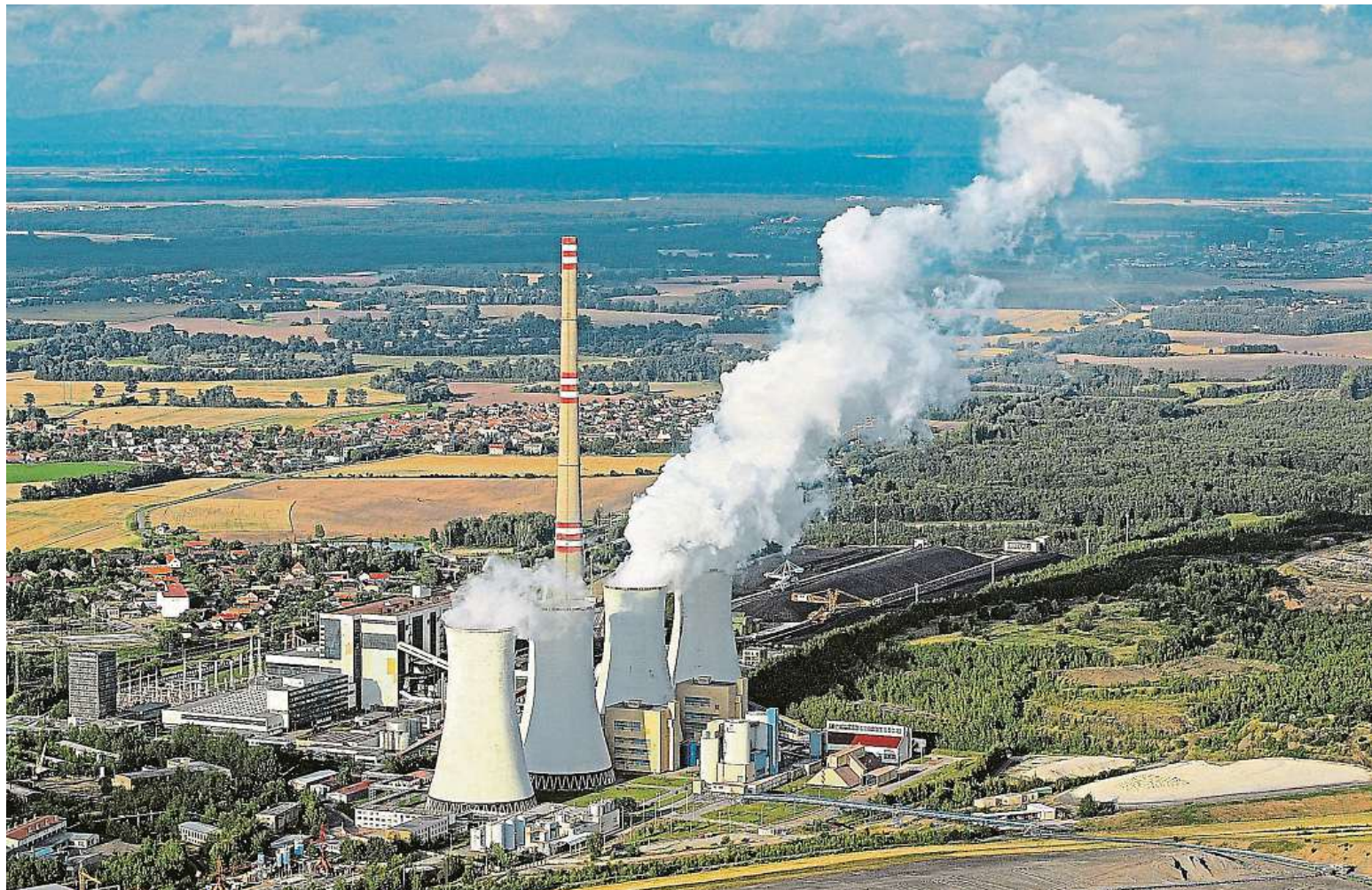
Elektrárna Chvaletice je jedním z největších výrobců elektřiny v Česku. Intenzivně se věnuje hledání technologií ke snížení emisí.