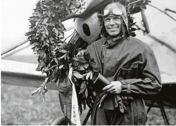
Major Alois Vicherek po ustanovení světového rekordu 7. června 1928, kdy uletěl 2500 km za 19.53 hodin