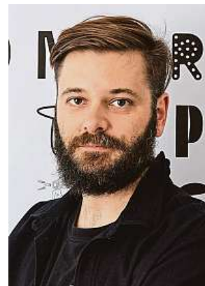
První z dvojice typografů