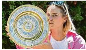
Markéta Vondroušová

Vedle světové sedmičky Vondroušové jsou v hlavní soutěži žen i Karolína Muchová, Barbora Krejčíková, Petra Kvitová, Marie Bouzková, Karolína Plíšková, Linda Nosková, Kateřina Siniaková a Linda Fruhvirtová. Mezi muži mají jistý start vedle české jedničky Jiřího Lehečky i Tomáš Macháč a na základě