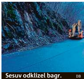
Sesuv odklízěl bagr. DB

„Tak to je tedy pěkný vánoční dárek, to údolí je snad prokleté. Může mi proboha někdo vysvětlit, proč se ko-