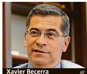
Xavier Becerra

Hlavním úkolem nového ministra zdravotnictví bude zejména řešení následků pandemie, v níž jsou USA nej-