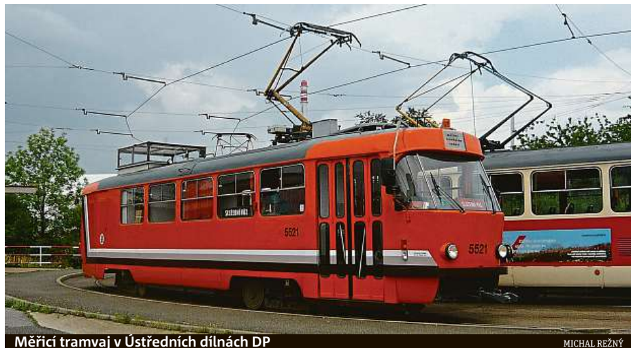
Měřicí tramvaj v Ústředních dílnách DP