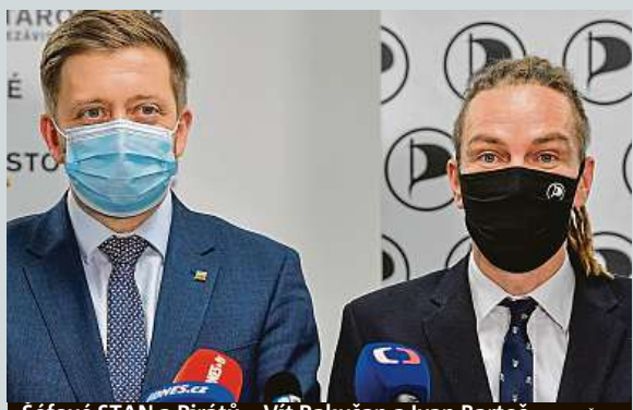
Šéfové STAN a Pirátů – Vít Rakušan a Ivan Bartoš

Podle Dvořáka není možné přesně říct, kolik vlků na Šumavě žije. „Víme určitě o sedmi, které se podařilo zaznamenat na fotopasti. Ale pravděpodobně jich bude ještě více,“ řekl mluvčí šumavského parku. Divocí vlci, kteří se do České republiky přirozeně šíří z okolních států, se na Šumavě objevují už více než tři desetiletí. Trvale zde žijí od roku 2015. Přestože občas vlka spatří i lidé, jde o velmi sporadický jev. ČTK