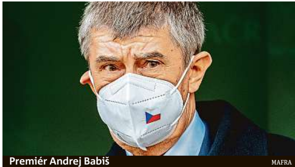
Premiér Andrej Babiš

Podstatou případu je to, že farma Čapí hnízdo původně