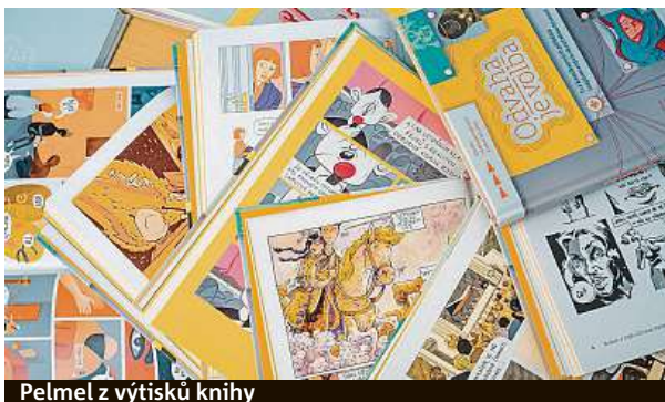
Pelmeň z výtisků knihy

Vovsíř, který s nápadem přišel, vidí v knize velký přelom. „Český skauting je s komiksem spojený od nepaměti. V minulosti to byly ale