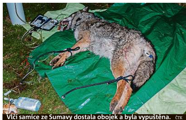
Vlčí samice ze Šumavy dostala obojek a byla vypuštěna. ČTK

Podal se jim husarský kousek. Po několika měsících vědci odchytili zvíře, které dokáže snadno objevit skrytou past a systematicky se jí vyhýbat.