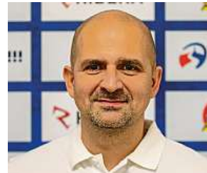
Miloš Holaň ČTK

Nové trenérské trio převzalo Vítkovice včera ráno a chys-