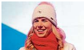
Ester Ledecká