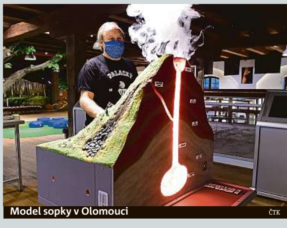
Model sopky v Olomouci

Podle Dvořáka není možné přesně říct, kolik vlků na Šumavě žije. „Víme určitě o sedmi, které se podařilo zaznamenat na fotopasti. Ale pravděpodobně jich bude ještě více,“ řekl mluvčí šumavského parku. Divocí vlci, kteří se do České republiky přirozeně šíří z okolních států, se na Šumavě objevují už více než tři desetiletí. Trvale zde žijí od roku 2015. Přestože občas vlka spatří i lidé, jde o velmi sporadický jev. ČTK