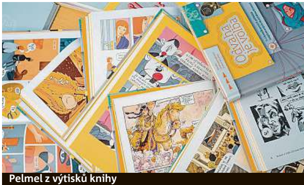
Pelmel z výtisků knihy

Vovsík, který s nápadem přišel, vidí v knize velký přelom. „Český skauting je s komiksem spojený od nepaměti. V minulosti to byly ale