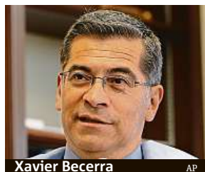
Xavier Becerra

Hlavním úkolem nového ministra zdravotnictví bude zejména řešení následků pandemie, v níž jsou USA nej-