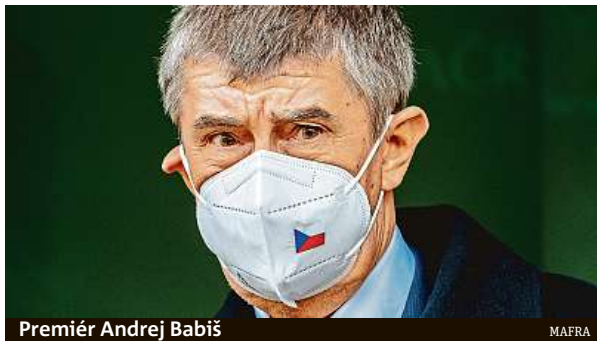
Premiér Andrej Babiš

Podstatou případu je to, že farma Čapí hnízdo původně