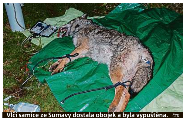
Vlčí samice ze Šumavy dostala obojek a byla vypuštěna.

Podal se jim husarský kousek. Po několika měsících vědci odchytili zvíře, které dokáže snadno objevit skrytou past a systematicky se jí vyhýbat.