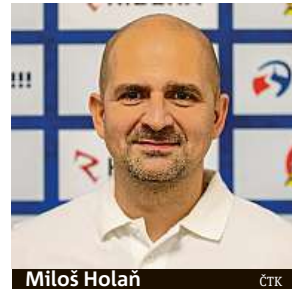
Miloš Holaň ČTK

Nové trenérské trio převzalo Vítkovice včera ráno a chys-