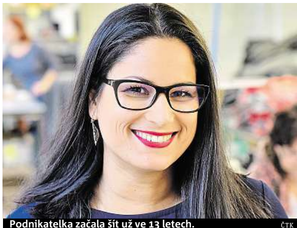
Podnikatelka začala šít už ve 13 letech.

Ježková si již ve 13 letech šila šaty. Podniká osm let, začala díky tomu, že sama děti