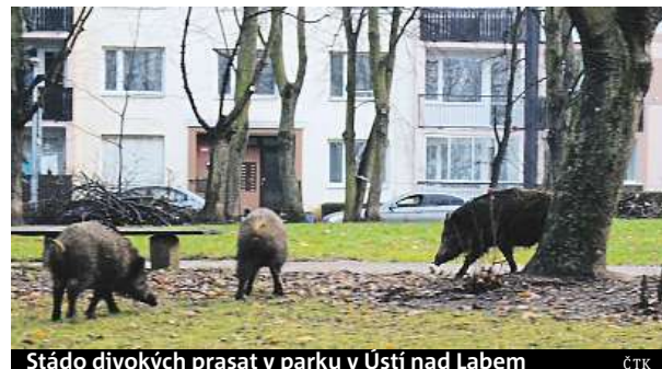
Stádo divokých prasat v parku v Ústí nad Labem

Podle německé policie muž sice utrpěl rovněž zranění na stehně, následně však spadl do vody a utopil se. „Prase divoké se v posledních zhruba deseti letech postup-