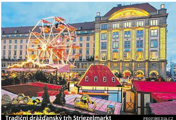
Tradiční drážďanský trh Striezelmarkt

Opět zůstaneme u hlavního města. Ne že by snad zbytek země nestál za to, ale z Londýna vánoční tajuplná atmosféra doopravdy vyzařuje.