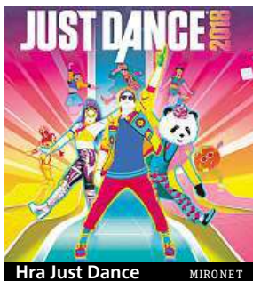
Hra Just Dance MIRONET

Just Dance 2018 je v pořadí již devátý díl oblíbené taneční série, která si po celém světě získala srdce více než 118 milionů amatérských i profesionálních tanečnic. Hru si