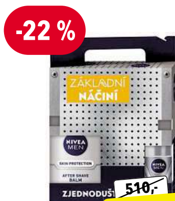
NIVEA MEN Tool Box Silver dárková sada