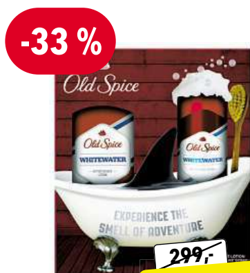
OLD SPICE Whitewater dárková sada