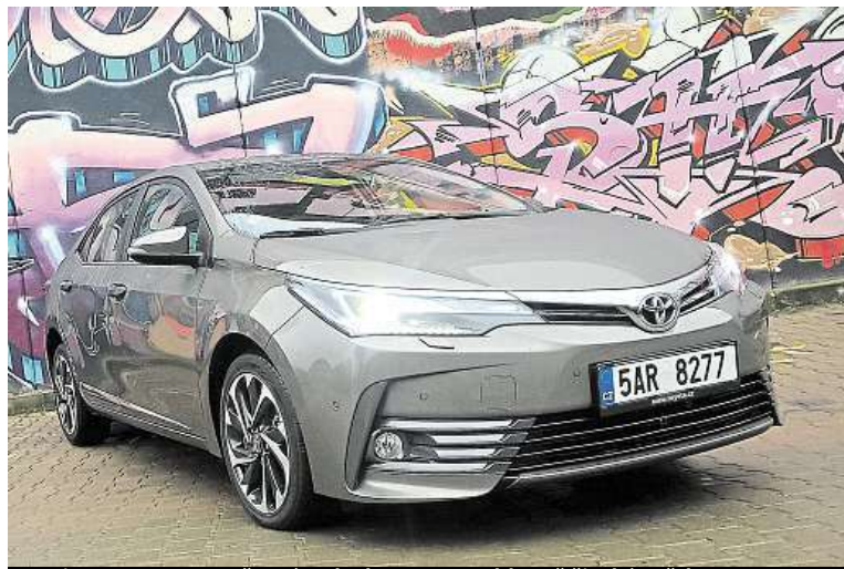
Design se nese v současném duchu Toyoty – hlavně široká světa.