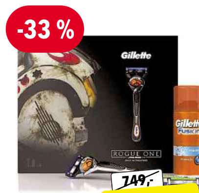
GILLETTE ProGlide Star Wars dárková sada