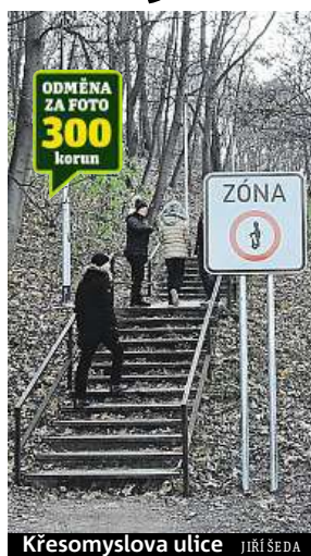
Křesomyslova ulice JIŘÍ ŠEDA

Do soboty, kdy mají začít oficiálně platit, by mělo v 250 pražských lokalitách stát 610 podobných značek. Do té doby je sem plánuje rozmístit Technická správa komunikací (TSK). Zatím je podle její mluvčí Barbory Liškové ze tří čtvrtin hotovo. Značky se však neosazují podle logiky, ale schválené dokumentace. „Zákazy vjezdu osobních přepravníků vyznačují hranici zóny, tedy nejen motoristické, ale i nemotoristické komunikace,“ řekla deníku Metro Lišková. Městští strážníci budou tedy