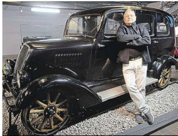
Na výstavu se přijel podívat i sám Jiří Menzel.

Úspěšný snímek, natočený roku 1966 v režii Jiřího Menzela podle stejnojmenné předlohy Bohumila Hrabala ve stanici Loděnice na trati Praha-Smíchov – Rudná u Prahy – Beroun, zachytil každodennost venkovského nádraží mezi roky 1939 a 1945 a situaci, kdy partyzánské skupiny podporované českými železničáři, kteří znali logisti-