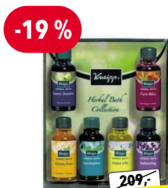
KNEIPP Herbal Bath dárková sada