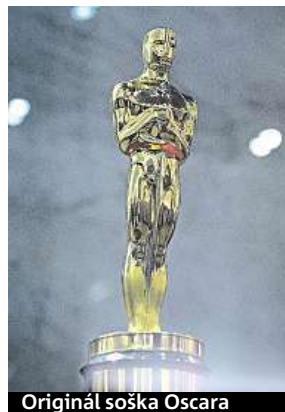
Originál soška Oscara

ku ostře sledovaných vlaků, tedy transportů s vojenským materiálem, uskutečňovali akce, které pomáhaly rozkládat válečné hospodářství na-