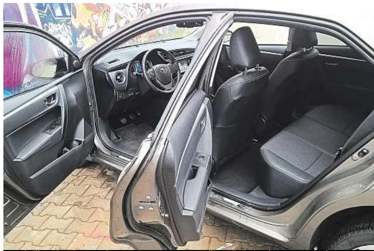
Sedačka je nastavená na 190cm postavu. Všimněte si místa na nohy!