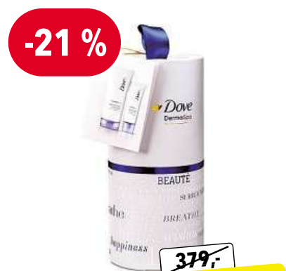
DOVE Derma Spa Cashmere dárková sada