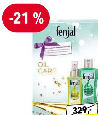
FENJAL Oil Care dárková sada