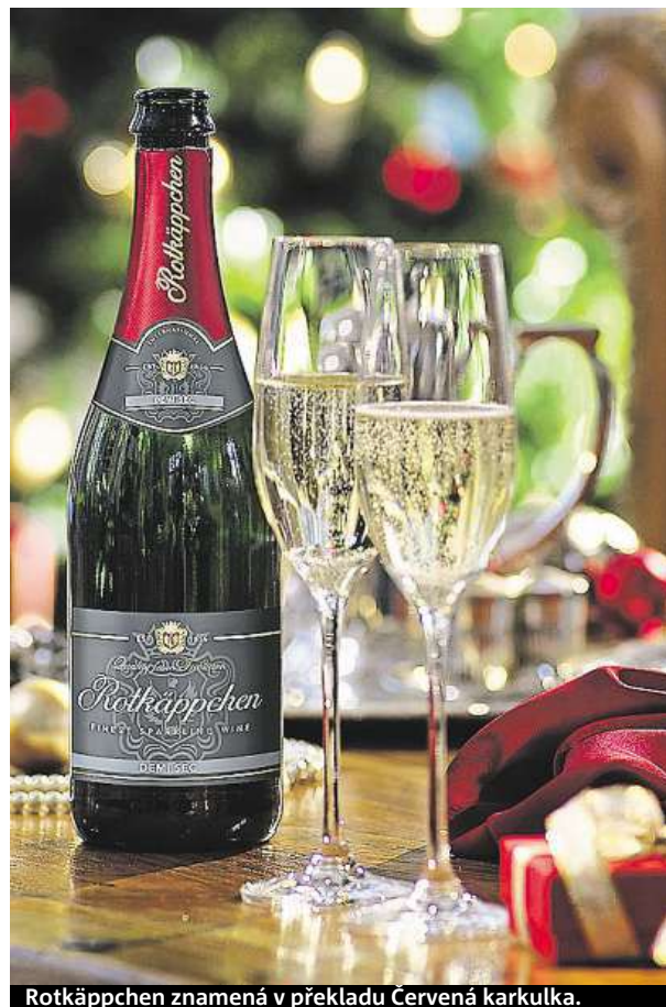
Rotkäppchen znamená v překladu Červená karkulka.

Rotkäppchen Demi Sec se skvěle hodí právě k cukroví, sladkým pokrmům a dezertům, kterých je ve svátečním čase plná tabule. Servírujte lahodnou sklenku vždy v odpovídající teplotě. Zatímco pro sekt se hodí teplota 8 °C, bílé víno si nejlépe vychutnáte v teplotě okolo 11 ° a červené ještě o pár stupňů teplejší, okolo 16 °.