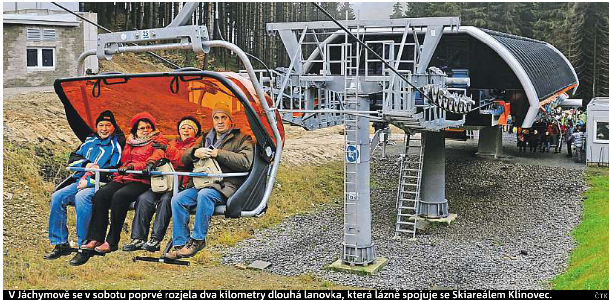
V Jáchymově se v sobotu poprvé rozjela dva kilometry dlouhá lanovka, která lázně spojuje se Skiareálem Klínovec.

Zbojnický plátek? Kdepak, už od soboty musí být v lístku uvedeno, z čeho se jídlo skládá a zda obsahuje některý ze 14 alergenů určených Unii. Odborníci. Alergologové i šéfkuchaři se bouří, že je to nesmysl STRANA 8