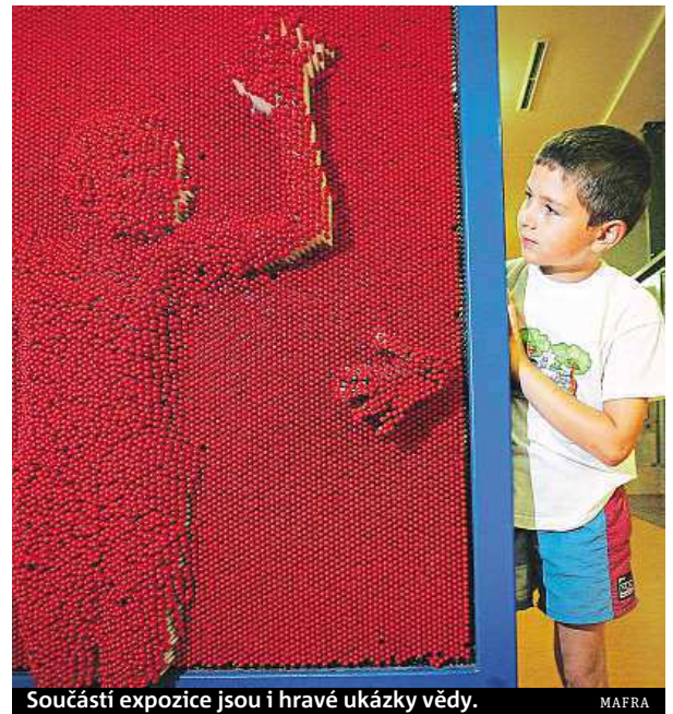
Součástí expozice jsou i hravé ukázky vědy.

čeká přestavba a modernizace. Postupně by se měly změnit expozice ve všech třech podlažích, každého půl roku jedno patro. V parku postupně vzniknou čtyři nové expozice pro mladší děti, zaměřené budou na svět kolem nás, schopnosti a dovednosti, malou vědu a zážitky. „Bude to zaměřené na obecnou školu a součástí bude také velká dílna pro děti, kde budou ponky a nářadí. Děti tam budou moci pracovat v rámci vyučování, o víkendech budou dílny otevřeny rodičům s dětmi,“ vysvětlil Coufal. Cílem je přivést děti k řemeslům. Na školách už totiž praktické vyučování a dílny většinou chybí. „A málokdo už má dnes doma nářadí, aby si to děti mohly vyzkoušet,“ dodal. Podobná praktická dílna a laboratoře by měly do roku 2018 vyrůst i v iQLandii. ČTK