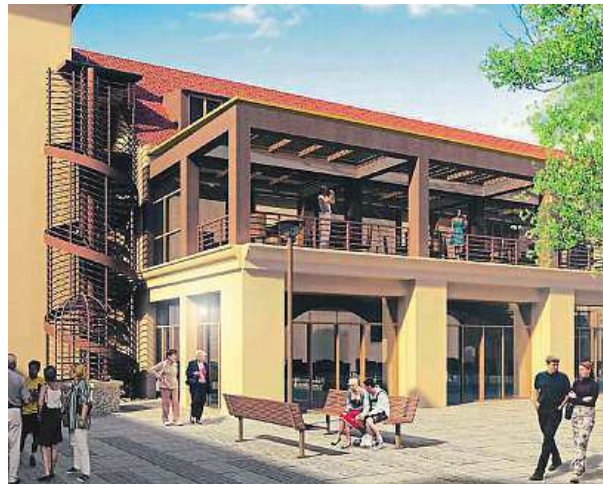
Budoucí podoba dvora pivovaru

„Dominikánský dvůr jsme vybrali kvůli jeho genui loci. Pivovarská tradice tu existovala od roku 1626 a skončila