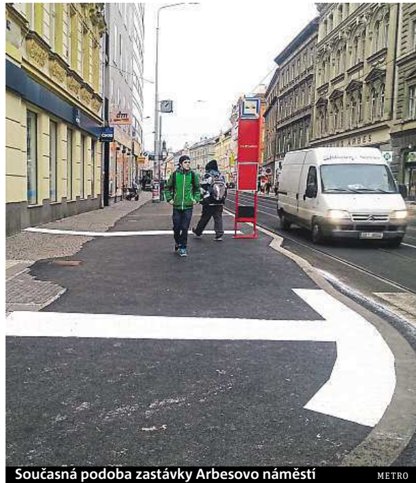
Současná podoba zastávky Arbesovo náměstí