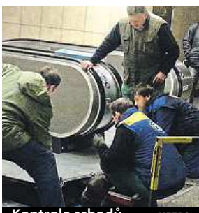
Kontrola schodů METRO

„Během nepřetržité sedmnáctihodinové kontroly byly