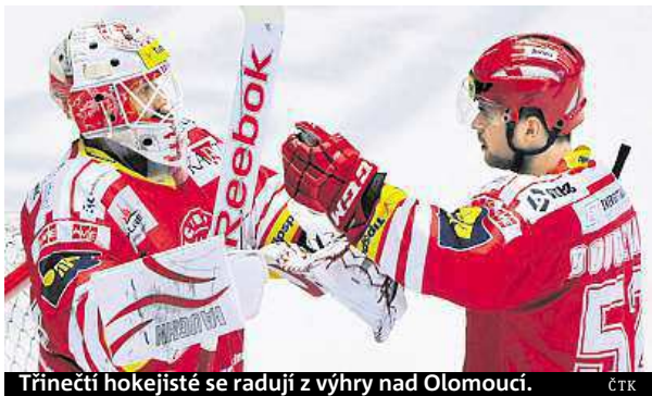
Třinečtí hokejisté se radují z výhry nad Olomoucí.

Drama zažili fanouškové v Plzni, kde domácí hokejisté zdolali Litvínov až po prodloužení 6:5. V utkání plněm vyloučení ztratila Plzeň čtyřbrankové vedení. Domácí