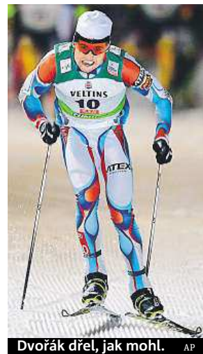
Dvořák dřel, jak mohl.

Turné zcela ovládli domácí Norové. Ženy obsadily první