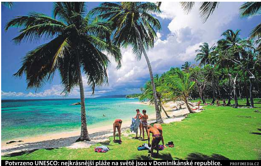
Potvrzeno UNESCO: nejkrásnější pláže na světě jsou v Dominikánské republice.

Svatý Bartoloměj v anketách českých turistů vede ze všech ostrovů Malých Antil, kam by se chtěli vydat. A to i před o něco známějším Martinikem. Ostrov za své bohatství, které získává z cestovního ruchu, může poděkovat