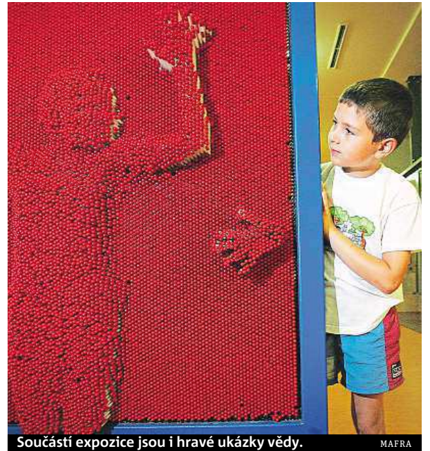
Součástí expozice jsou i hravé ukázky vědy.

čeká přestavba a modernizace. Postupně by se měly změnit expozice ve všech třech podlažích, každého půl roku jedno patro. V parku postupně vzniknou čtyři nové expozice pro mladší děti, zaměřené budou na svět kolem nás, schopnosti a dovednosti, malou vědu a zážitky. „Bude to zaměřené na obecnou školu a součástí bude také velká dílna pro děti, kde budou ponky a nářadí. Děti tam budou moci pracovat v rámci vyučování, o víkendech budou dílny otevřeny rodičům s dětmi,“ vysvětlil Coufal. Cílem je přivést děti k řemeslům. Na školách už totiž praktické vyučování a dílny většinou chybí. „A málokdo už má dnes doma nářadí, aby si to děti mohly vyzkoušet,“ dodal. Podobná praktická dílna a laboratoře by měly do roku 2018 vyrůst i v iQLandii. ČTK