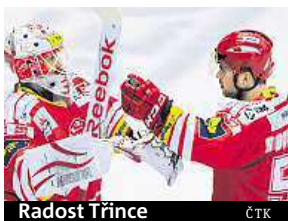
Radost Třince.

Drama zažili fanouškové v Plzni, kde domácí hokejisté