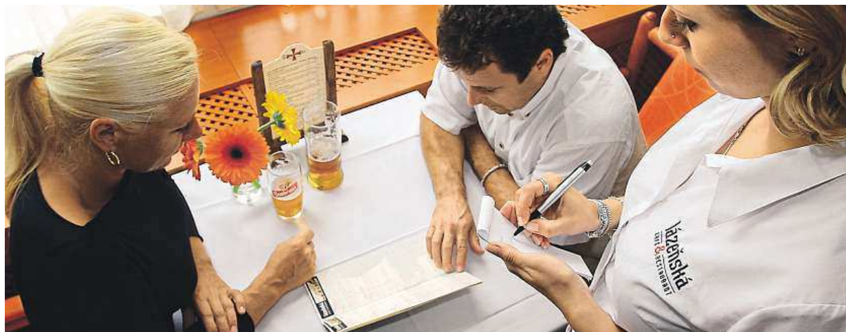
Možná už za týden zažijeme situaci, kdy hosté požádají obsluhu o seznam alergenů v zeleninovém vývaru.