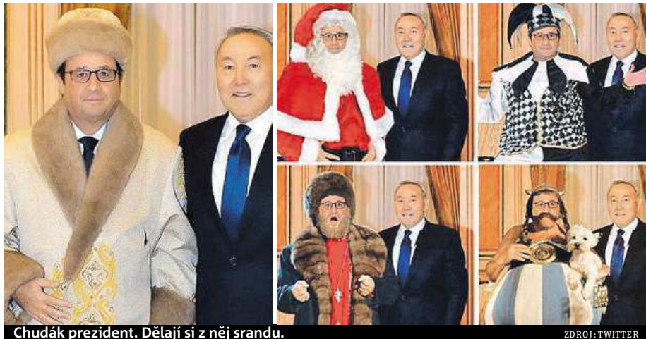
Chudák prezident. Dělají si z něj srandu.

Kazašské úřady snímek vyvěsily na oficiální stránku prezidentského paláce na sociální síti Instagram. Na žádost Francouzů byla ale velmi rychle ze stránky odstraněna. Paříž prý během návštěvy trvala na tom, že žádné snímky, kde má prezident na sobě tento dar od svého ka-