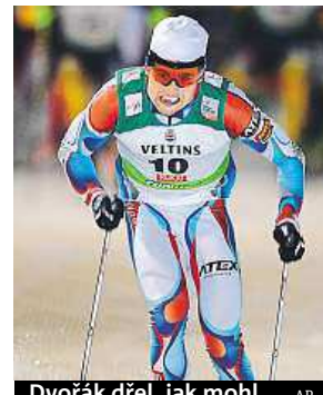
Dvořák dřel, jak mohl.

Nejlepší muž Lukáš Bauer dokončil závěrečný stíhací