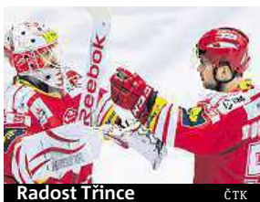
Radost Třince.

Drama zažili fanouškové v Plzni, kde domácí hokejisté