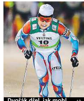
Dvořák dřel, jak mohl.

Nejlepší muž Lukáš Bauer dokončil závěrečný stíhací