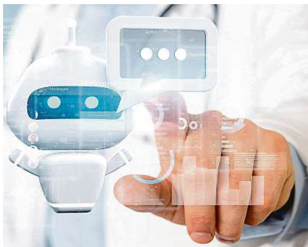
Robot pomůže, návštěvu lékaře ale nenahradí.

Svěřit se on-line vyhledávací se svým zdravotním stavem má své výhody, ale také rizika. Jak odhalila harvardská studie, vyhledávání symptomů na internetu může být nepřesné, a dokonce nebezpečné. Špatná identifikace ne-