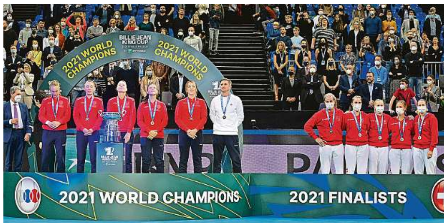
O vítěžkách poháru Billie Jean Kingové rozhodly už úvodní dvouhry.

„Buď se zranila sama, což by bylo nešťastné, nebo to