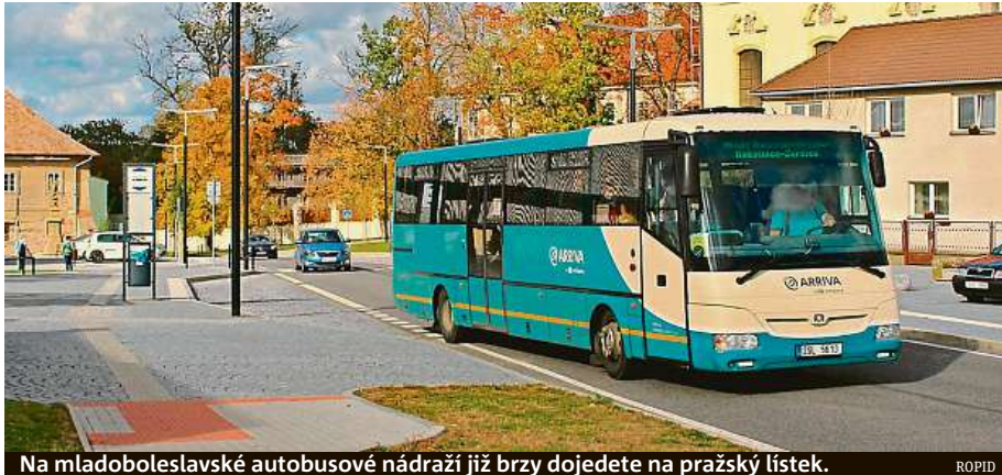
Na mladoboleslavské autobusové nádraží již brzy dojedete na pražský lístek.

Podle mluvčího organizátora dopravy Řopid Filipa Drápal tak budou autobusové spoje od metra Černý Most nově jezdit po dálnici na boleslavský autobusák v základním intervalu dvaceti minut.