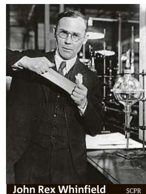
John Rex Whinfield