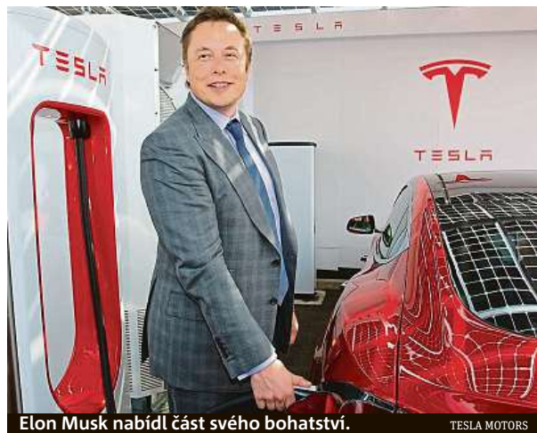
Elon Musk nabídl část svého bohatství.

Musk hlasování inicioval poté, co se v americkém Kon-