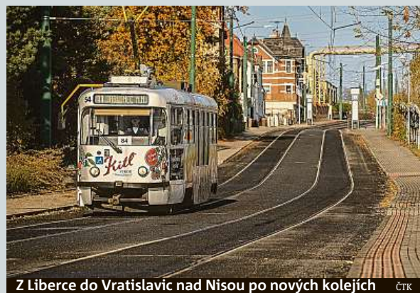
Z Liberce do Vratislavic nad Nisou po nových kolejkách ČTK

Původní metrový rozchod byl rozšířen na standardních 1435 mm. O víkend byla pro klasické tramvaje otevřena část této trasy mezi Libercem a Vratislavicemi nad Nisou (viz foto). Odsud až do konečné zastávky v Jablonci zatím jezdí autobusy. Zajímavostí této tramvajácké atrakce bylo, že jste tady mohli vidět při jednom směru vedle sebe koleje tři. Mohly tu totiž jezdit jak tramvaje s koly blíž u sebe, tak ty standardní. MAP