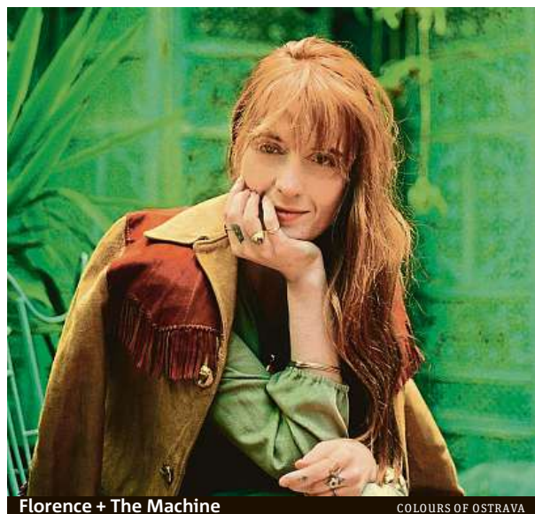
Florence + The Machine