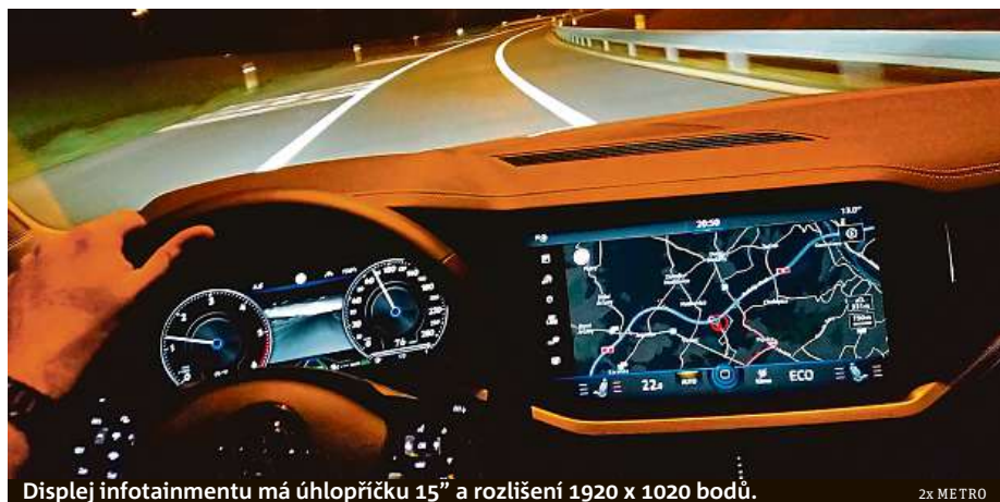
Displej infotainmentu má úhlopříčku 15" a rozlišení 1920 x 1020 bodů.