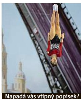
Napadá vás vtipný popisěk?

Napište bublinu a reagujte na sloupek na: www.facebook.com/denikmetro