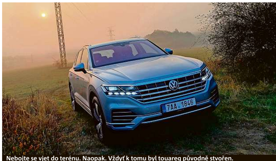
Nebojte se vjet do terénu. Naopak. Vždyť k tomu byl touareg původně stvořen.