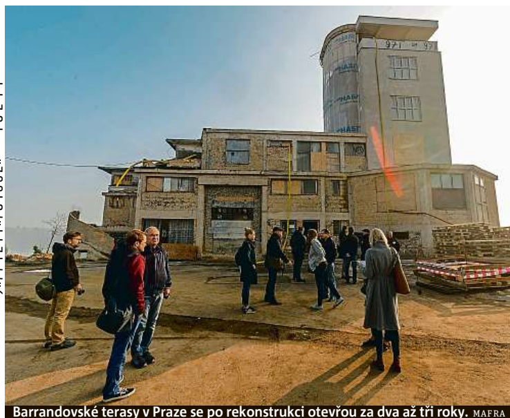
Barrandovské terasy v Praze se po rekonstrukci otevrou za dva až tři roky.