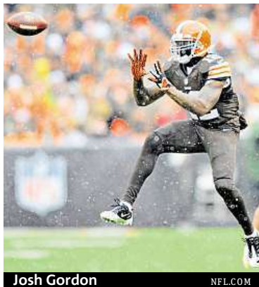
Josh Gordon

V roce 2014 dostal trest za řízení motorového vozidla pod vlivem omamných látek. Od té doby si kvůli opakovaným trestům za porušení antidopingových pravidel ligy nezahrál. Od tohoto týdne zase může trénovat s Clevelandem s tím, že v prosinci by mohl zase hrát NFL.