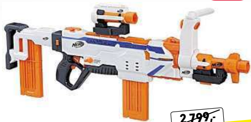
Nerf Modulus Regulator

Automatická pistol s přepínáním střelby Balení obsahuje pistol a 24 šipek