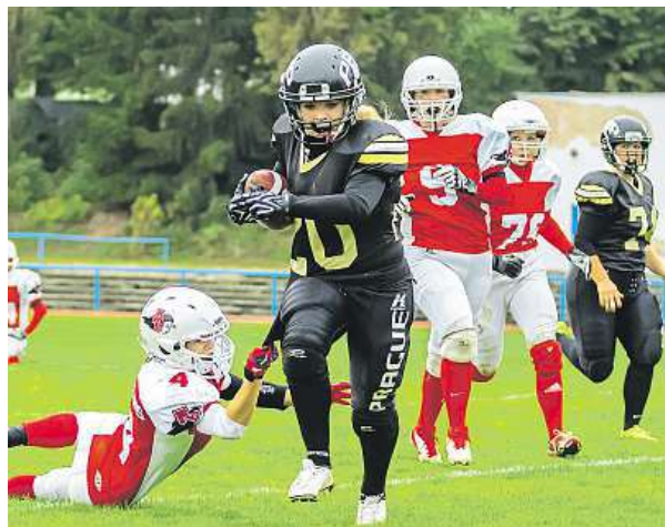
Favoritkami budou Amazons, které letos neprohrály. BRB III

Poté nás čeká v americkém fotbalu pauza až do dubna, kdy svoji soutěž opět zahájí muži.