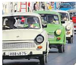
Foto ze srazu MAFRA

py, ale i ve Spojených státech či Austrálii. Ve Cvikově v pátek otevře rozšířené prostory Muzeum Augusta Horcha.