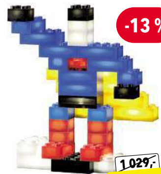
Light Stax Creative

Svítlící stavebnice pro rozvoj fantazie Vhodné od 6 let, jednoduchá manipulace