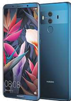
Rozpoznává objekty. MIRONET

Huawei Mate 10 Pro představuje to nejlepší, co může třetí největší výrobce telefonů na světě nabídnout. Pyšní se bezrámečkovým „Full-View“ OLED displejem s vyni-