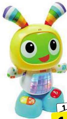
Fisher-Price - Beatbo Cz

Didaktická hračka, mluví a zpívá Pro rozvoj smyslů, motoriky