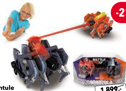
Hexbug Bojové tarantule s dálkovým ovladačem

Zažij futuristický souboj světelným paprskem. Otáče se, stříle a postupuj do všech stran. K dispozici také mrštní bojovní pavouci.