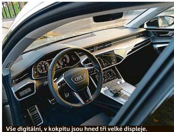
Vše digitální, v kokpitu jsou hned tři velké displeje.