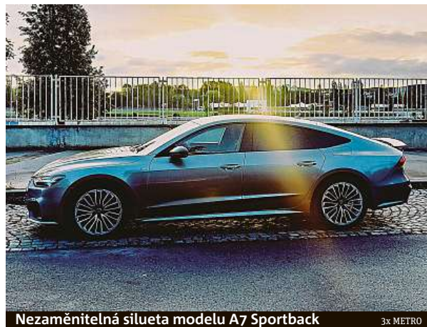
Nezaměnitelná silueta modelu A7 Sportback