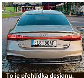
To je přehlídka designu.

Celá sestava výborně spolupracuje sedmistupňovou převodovkou S tronic, přičemž pohon je na všechny čtyři kola. Auto je docela těžké, při hmotnosti 2140 kg ovšem na-