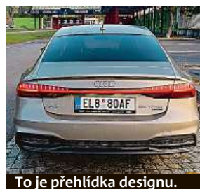
To je přehlídka designu.

bízí opravdu svižné svezení. Zrychlení z nuly na sto za 5,7 sekundy je krásná hodnota, jen pokud chcete co nejvíce využívat dojezd na čistě elektrický pohon, moc plynový pedál nedrážděte.