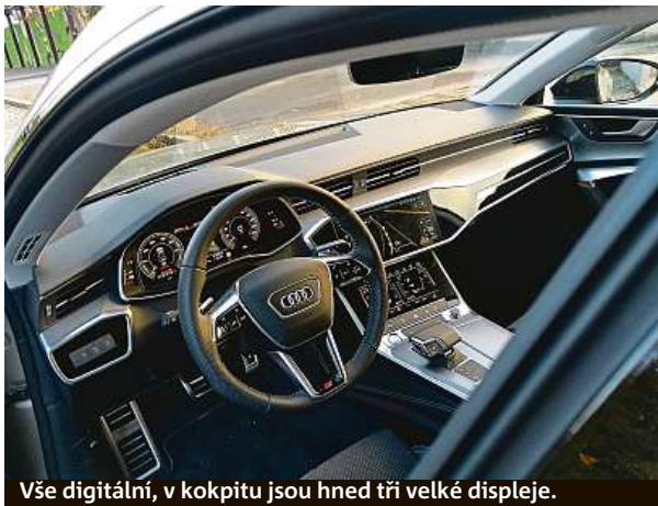
Vše digitální, v kokpitu jsou hned tři velké displeje.