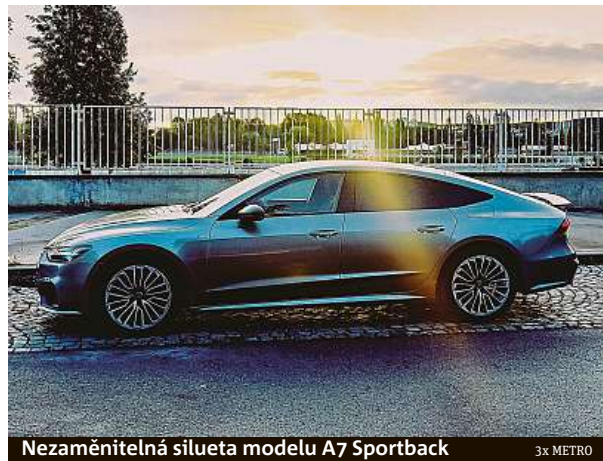
Nezaměnitelná silueta modelu A7 Sportback

Celá sestava výborně spolupracuje sedmistupňovou převodovkou S tronic, přičemž pohon je na všechny čtyři kola. Auto je docela těžké, při hmotnosti 2140 kg ovšem na-