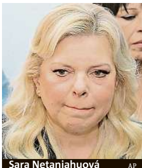
Sara Netanjahová

Manželka šéfa izraelské vlády objednávala jídlo v restauraci, přestože měli v sídle kuchaře.