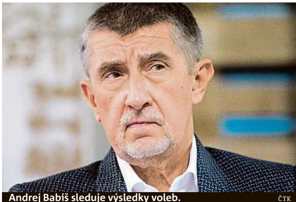
Andrej Babiš sleduje výsledky voleb.

Hlavní město není premiérovi nakloněno. Babišovi se nepodařilo uplatit pražská sídliště rozdáváním jídla a Gotta, píše zahraniční tisk.