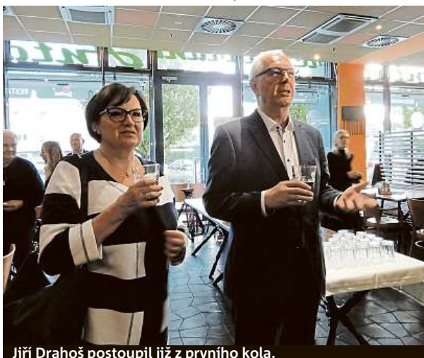
Jiří Drahoš postoupil již z prvního kola.

Jiří Drahoš pozval úzký tým spolupracovníků do restaurace kousek od stanice metra Budějovická. Jako