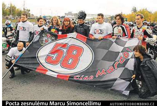
Pocta zesnulému Marcu Simoncellimu

pořadatelé zjistí počet účastníků. „Akce je vhodná pro všechny typy motocyklů – od skútrů, přes mopedy a historické stroje, až po závodní motocykly bez registrační značky. Důležitý je však dobrý technický stav stroje,“ říká Smetana. RADEK BABIČKA