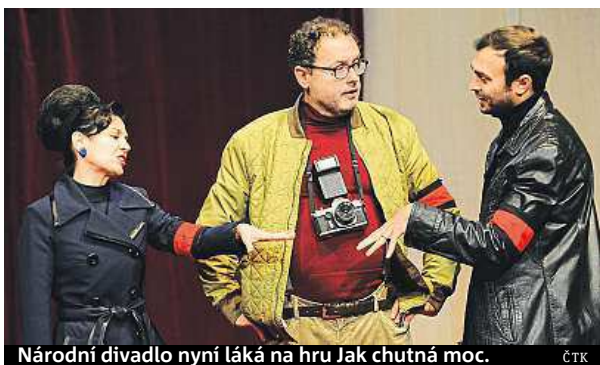
Národní divadlo nyní láká na hru Jak chutná moc.

Národní divadlo v Brně jen před pár dny uvedlo premiéru hry Jak chutná moc na motivy románu slovenského autora Ladislava Mňačka. Už za dva dny má premiéru balet Louskáček Petra Iljiče Čajkovského. V listopadu pak uvede Janáčkovu operu podle hry Karla Čapka Věk Makropulos.