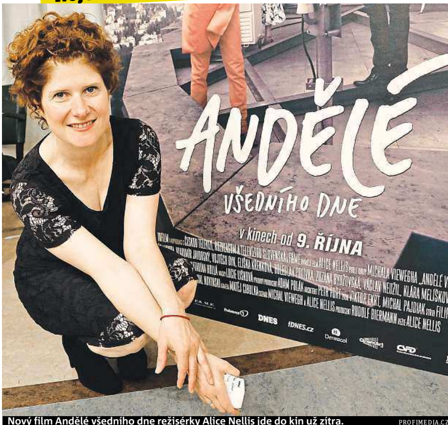
Nový film Andělé všedního dne režisérky Alice Nellis jde do kin už zítra.