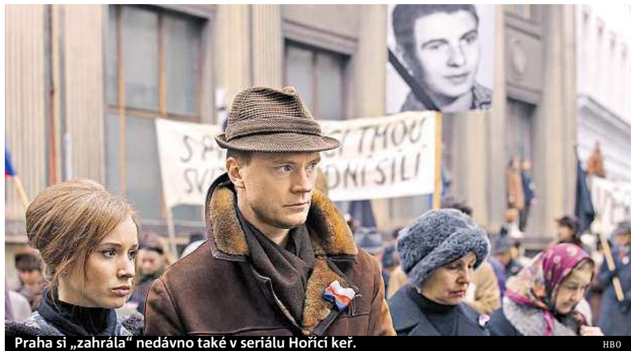
Praha si „zahrála“ nedávno také v seriálu Hoříci keř.

opravit. Překvapila nás zde také průtrž mračen, která málem smetla hlavní stan v areálu, kde celý štáb natáčel. V se-