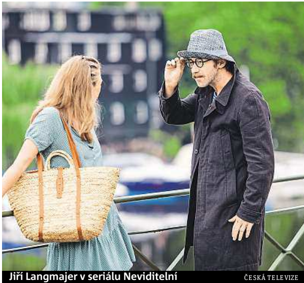
Jiří Langmajer v seriálu Neviditelní

Natáčení paradoxně komplikoval právě vodní živel. „Ve Žlutých lázních jsme všichni sledovali povodně,