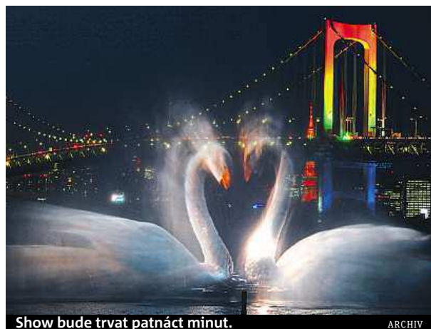
Show bude trvat patnáct minut.