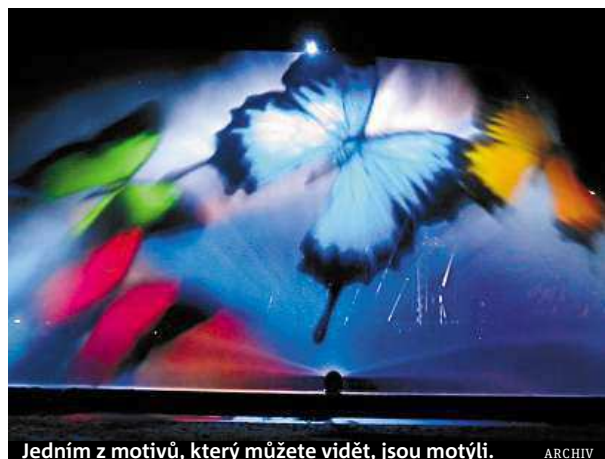
Jedním z motivů, který můžete vidět, jsou motýli.