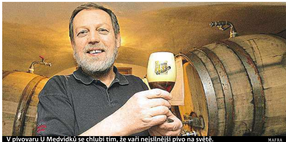
V pivovaru U Medvídků se chlubí tím, že vaří nejsilnější pivo na světě.