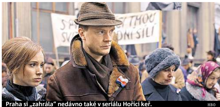
Praha si „zahrála“ nedávno také v seriálu Hořící keř.