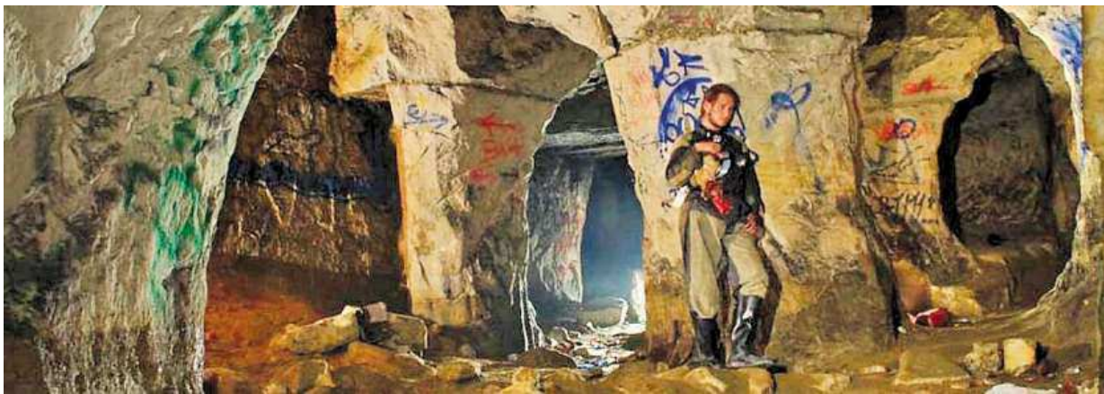
Návštěvníky čeká i prohlídka skalního bludiště.

Skupinky o třinácti až dvaceti lidech vybavené baterka-