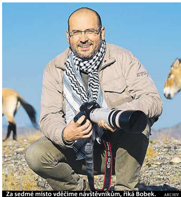
Za sedmé místo vděčíme návštěvníkům, říká Bobek.

Pro děti i jejich rodiče připravujeme v podstatě každý