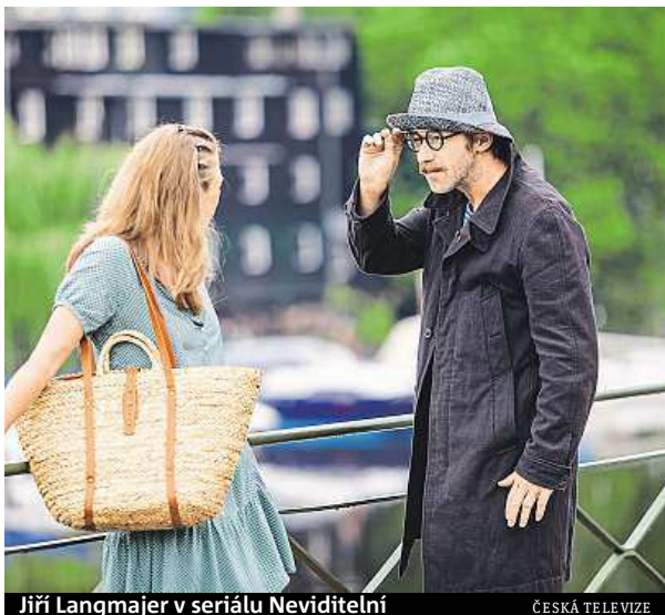
Jiří Langmajer v seriálu Neviditelní

Natáčení paradoxně komplikoval právě vodní živel. „Ve Žlutých lázních jsme všichni sledovali povodně, protože místo, kde bylo natáčení domluveno, bylo ještě pár dnů předtím zdevastováno. Vše se našťastí podařilo opravit. Překvapila nás zde také průtrž mračen, která má-