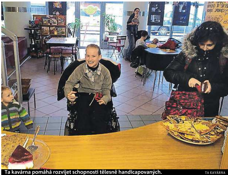
Ta kavárna pomáhá rozvíjet schopnosti tělesně handicapovaných.

„V naší kavárně vždy potkáte dva lidi s tělesným postižením v roli obsluhy a za nimi trenéra, který funguje jako jejich pomocník, občasný navigátor, prodloužená ruka a také velký dřič v momentech, kdy kavárna praská ve švech,“ vysvětluje, jak funguje provoz. MAREK HÝŘ