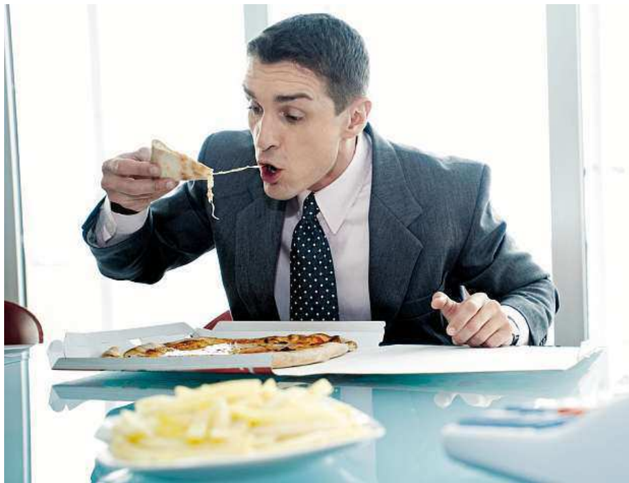
Kromě oblíbených jídel z domova vzrostla i obliba donáškových jídel.

• Osamělá Hanka 34. Přítel úspěš v podnikání a pomalu zapomněl na obyčejný život. Netoužím po luxusu a drahých dárkách. Sex, vášně to je to, co mi v životě chybí! Pomůžeš mi? T.: 909 801 801 nebo piš SMS na 909 15 50 s kódem 42GFN a tvůj text!