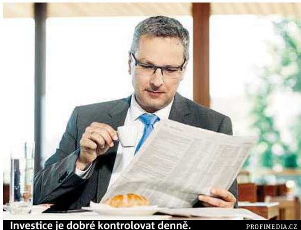
Investice je dobré kontrolovat denně.

Podle Šichtařové je dobré kontaktovat někoho, kdo se specializuje na poradenství a sám neobchoduje ani nemá