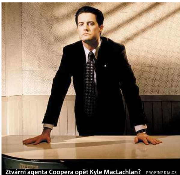
Ztvární agenta Coopera opět Kyle MacLachlan?

„Záhadný a zvláštní svět Twin Peaks se vrací. Jsme opravdu nadšení,“ uvedl Lynch ve společném prohlášení s Markem Frostem, který se podílel na vzniku původní série. Nových dílů bude celkem devět a na televizních obrazovkách se objeví v roce 2016. Odvysílá je kabelová televizní stanice Showtime. Pokračování seriálu, který na počátku 90. let nadchl nejen diváky, ale i filmové kritiky, bude zasazeno do současnosti. Tvůrci slíbují,