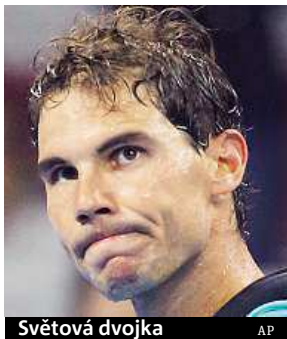
Světová dvojka

Španělský tenista Rafael Nadal bude hrát na turnaji v Šanghaji navzdory tomu, že mu byl o víkendu diagnostikován zánět slepého střeva. Čtrnáctinásobný grandslamový vítěz se léčí antibiotiky a měl by dnes nastoupit k utkání druhého kola proti krajanovi Felicianu Lópezovi. Osmadvacetiletý Nadal pocítil bolest v podbřišku v sobotu večer a v neděli jel na vyšetření do nemocnice.