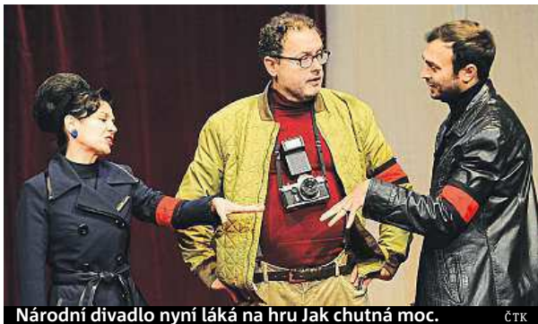
Národní divadlo nyní láká na hru Jak chutná moc. ČTK

Národní divadlo v Brně jen před pár dny uvedlo premié- ru hry Jak chutná moc na mo- tivy románu slovenského au- tora Ladislava Mňačka. Už za dva dny má premiéru balet Louskáček Petra Iljiče Čaj- skovského. V listopadu pak uvede Janáčkovu operu podle hry Karla Čapka Věk Makro- pulos.