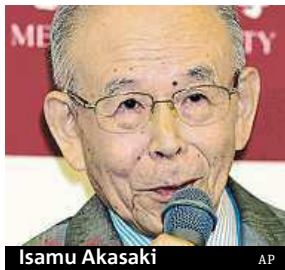
Isamu Akasaki

Letošní Nobelovu cenu za fyziku získali Japonci Isamu Akasaki a Hiroši Amano a Američan japonského původu Shuji Nakamura za vývoj modrých světelných diod umožňujících vytvoření nového, ekologického světelného zdroje. Vynález 85letého Akasakiho (viz foto) a jeho podstatně mladších kolegů – 54letého Amana a 60le-