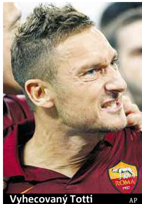
Vyhecovaný Totti

Nedělní duel mezi Juventusem a AS Řím se řešil i v italském parlamentu. Podle mnohých poškodil rozhodčí římský celek.