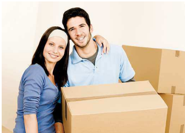
Velmi časté je v současné době investování do bydlení.