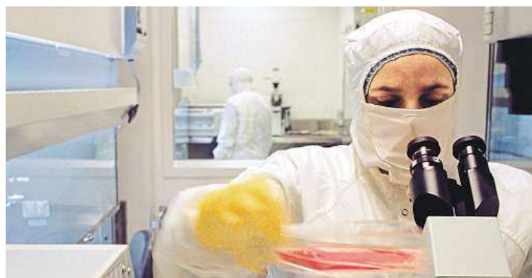
Mnoho firem už nyní spolupracuje s vědci.

spolupráce patří společný výzkum (72 %), výzkum na zakázku (43 %) a angažování studentů a doktorandů (49 %),“ uvádí se ve zprávě. MET