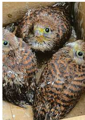
Mladé poštolky obecně přijaté v bartošovické stanici 2x ČSOP

Podle Přemysla Rabase, ředitele Safari Parku Dvůr Králové a známého odborníka na problematiku zoologických zahrad, by ale byl podobný postup více než nesmy-