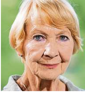
Letos v Karlových Varech MAFRA