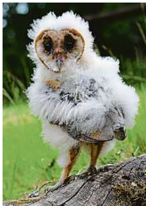
Mládě sovy pálené ze zničeného hnízda je chováno v ZS Pavlov.

„V zoologických zahradách jich zvířata zkonsumují odhadem dva miliony. Pokud k zákazu dojde, některé záchranné stanice horko těžko nahradí kuřátka myškami, jiné sta-