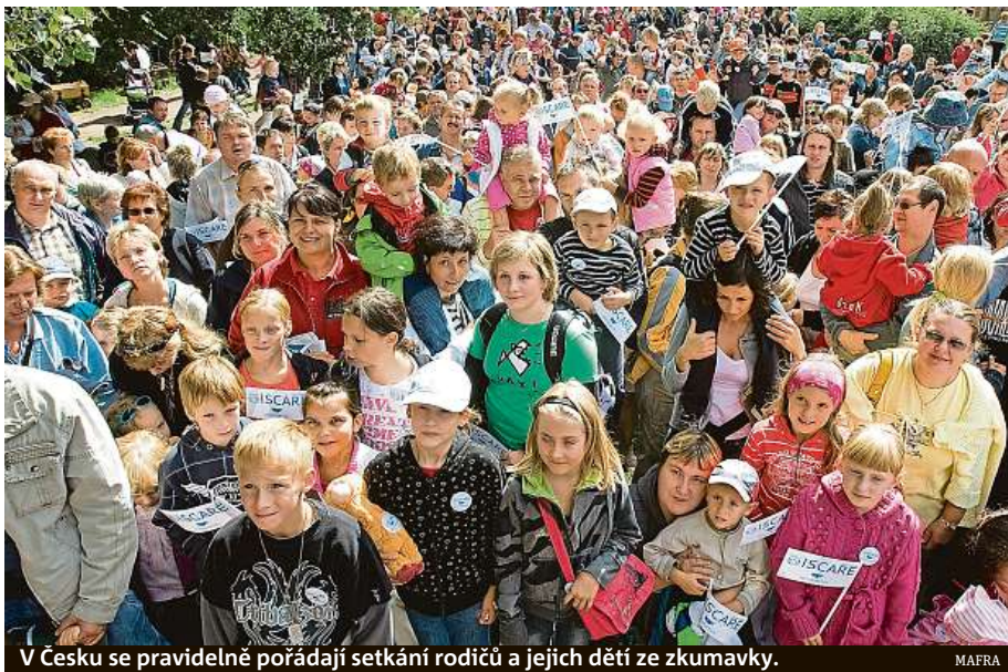
V Česku se pravidelně pořádají setkání rodičů a jejich dětí ze zkumavky.

„Nestresuj se, nemysli na to! Jinak neotěhotníš!“ Kolik dívek a žen v reprodukčním věku už slyšelo tuhle větu od někoho z rodiny nebo od kamarádek. Podobné názory zcela pochopitelně ženu, ale i jejího partnera, pokud je u toho, psychicky depatují. „Souvislost mezi psychikou a plodností existuje,“