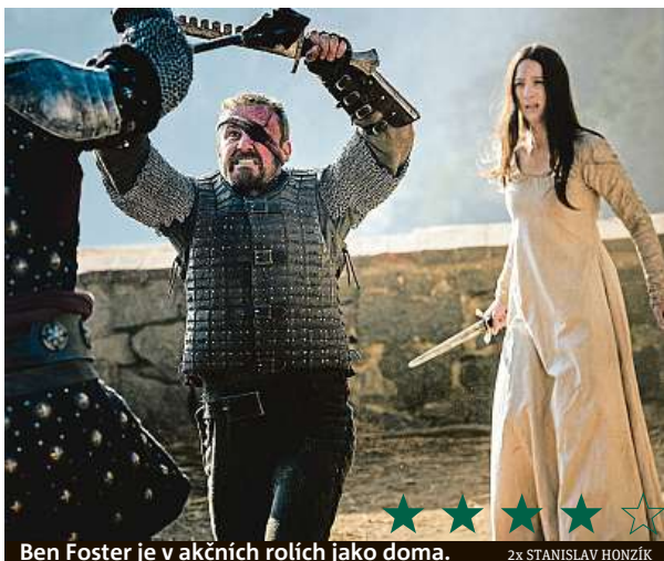
Ben Foster je v akčních rolích jako doma.

Ošklivá smrt potká hned několik tuzemských herců. Zatímco v jiných filmech zmiňovaní hrají hlavní role, v Janu Žižkovi dostanou větší