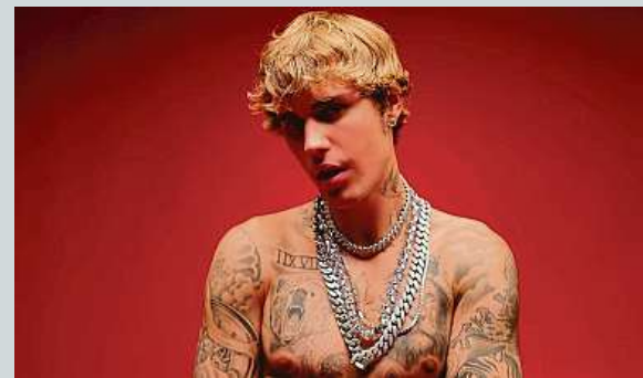
Hvězda pop a R&B Justin Bieber v roce 2020