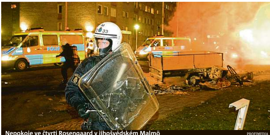
Nepokoje ve čtvrti Rosengård v jihošvédském Malmö

Podle údajů švédské národní rady pro prevenci kriminality se v minulém desetiletí Švédsko změnilo ze země, která měla v Evropě jeden z nejnižších počtů úmrtí v důsledku střelby na obyvatele, na zemi, která má tento podíl nejvyšší. Letošní rok by mohl být v tomto ohledu rekordní; do poloviny srpna bylo v zemi tří korunek zaznamenáno 44 obětí střelby, zatím-