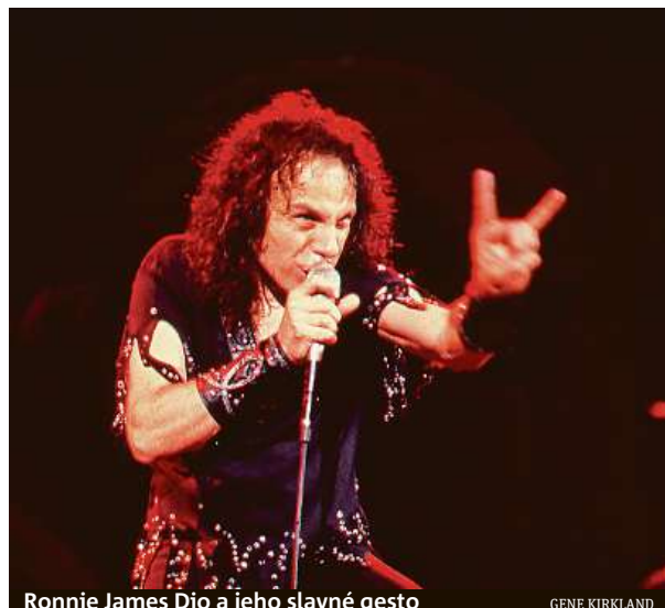
Ronnie James Dio a jeho slavné gesto

A aby byly kinoprojekce dokumentu ještě vzácnější, doprovází je další záběry, které při přípravě filmu zůstaly na podlaze střížny. MET