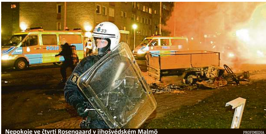
Nepokoje ve čtvrti Rosengård v jihošvédském Malmö

Podle údajů švédské národní rady pro prevenci kriminality se v minulém desetiletí Švédsko změnilo ze země, která měla v Evropě jeden z nejnižších počtů úmrtí v důsledku střelby na obyvatele, na zemi, která má tento podíl nejvyšší. Letošní rok by mohl být v tomto ohledu rekordní; do poloviny srpna bylo v zemi tří korunek zaznamenáno 44 obětí střelby, zatím-