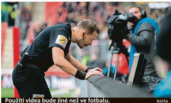
Použití videa bude jiné než ve fotbalu.

Náklady na pořízení systému byly více než sedm milionů korun. „Asociace ligových klubů i celá NBL si od zavedení IRS slibují zpřesnění některých výroků, protože basket je velice rychlá hra a nejlepší basketbalové soutěže už vi-