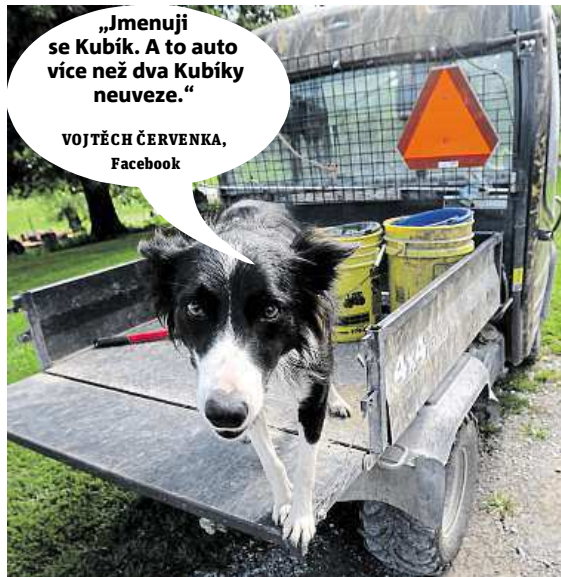
VOJTĚCH ČERVENKA, Facebook