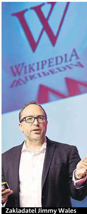
Zakladatel Jimmy Wales

Wikipedie zrušila celkem 381 profilů různých uživatelů, kteří psali o firmách a lidech, které pak vydírali.