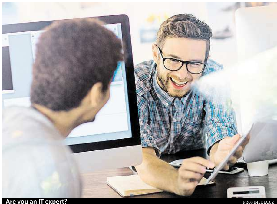
Are you an IT expert?