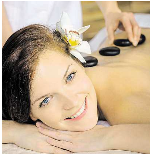
Masáž lávovými kameny

Masáží je nepřeborně množství. Některé mají povzbuzující účinky, jiné zklidňující. U většiny dochází ke zlepšení prokrvení svalů a vazivových tkání, ke snížení jejich tuhosti a zmírnění bolesti. Například sportovní masáž pomáhá urychlit regeneraci svalů po zátěži, a dosáhnout tak lepší svalové výkonnosti, při reflexní se zase dají ovlivnit porušené funkce některých orgánů. Jednotlivé masáže se liší především svým provedením, hmaty a intenzitou. KAMILA HUDEČKOVÁ