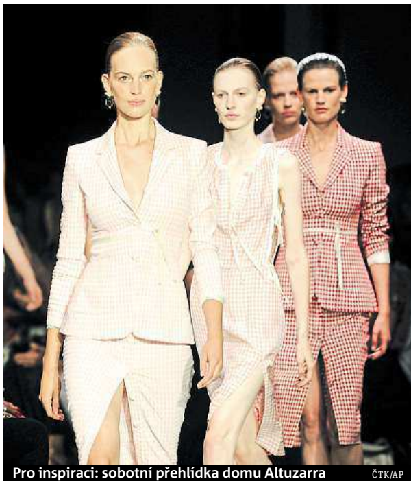
Pro inspiraci: sobotní přehlídka domu Altuzarra

Průměrná platba v době podzimních výprodejů činí 1120 korun, téměř všechny platby proběhnou v kamenných obchodech. Pozitivní zprávou je, že tyto útraty zvlá-