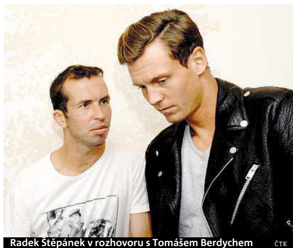
Radek Štěpánek v rozhovoru s Tomášem Berdychem

Berdych po vyřazení ve čtvrtfinále US Open s pozdějším finalistou Chorvatem Marinem Čiličem absolvoval rychlý návrat do Čech. „Přesun byl rychlý, dost na poslední chvíli. Doletěl jsem včera brzy ráno, jen jsem si přebalil věci, přehodil, co bylo potřeba a dnes ráno už zase jel sem na letiště,“ řekl včera Berdych. „Moc jsem toho nena-