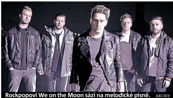
Rockpopoví We on the Moon sází na melodické písně.

Anglicky zpívající We on the Moon chystají novou desku. Vyjde v zimě.