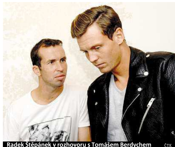
Radek Štěpánek v rozhovoru s Tomášem Berdychem

Berdych po vyřazení ve čtvrtfinále US Open s pozdějším finalistou Chorvatem Marinem Čiličem absolvoval rychlý návrat do Čech. „Přesun byl rychlý, dost na poslední chvíli. Doletěl jsem včera brzy ráno, jen jsem si přebalil věci, přehodil, co bylo potřeba a dnes ráno už zase jel sem na letiště,“ řekl včera Berdych. „Moc jsem toho nena-