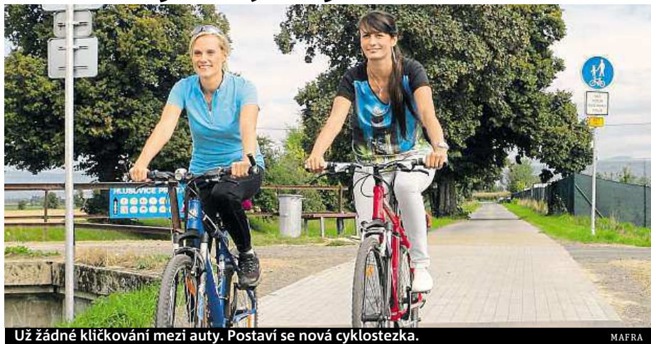
Už žádné klíčování mezi auty. Postaví se nová cyklostezka.

Cyklostezka povede nábřežím Svítavy. K její stavbě využijí projektanti lesní cesty a zelená prostranství. Stane se součástí 35 kilometrů dlouhé cyklotrasy, která vede většinou po nábřeží Svítavy z Brna na sever do Letovic. Blansko v uplynulých letech vybudovalo páteřní část svých cyklostezek. Protínají město od jihu k severu. Na Sportovním ostrově vznikl okruh pro in-line bruslaře nazvaný Blanenský triangl. Město na něm chce pořádat různé akce. ČTK