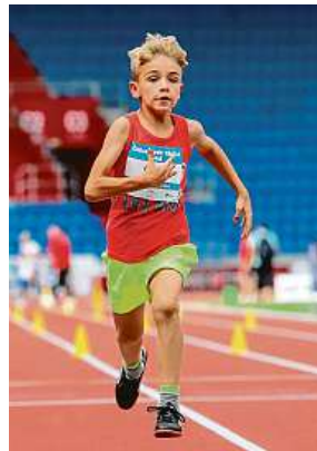
Děti, které zvládají běh a další fyzickou námahu, ubývá.

Každopádně to svědčí současně o menší fyzické aktivitě lidí, kteří v létě tráví ve svém druhém domově někdy i celé prázdniny. Na menší fyzickou aktivitu ukazuje i rostoucí prodeje kol s elektric-