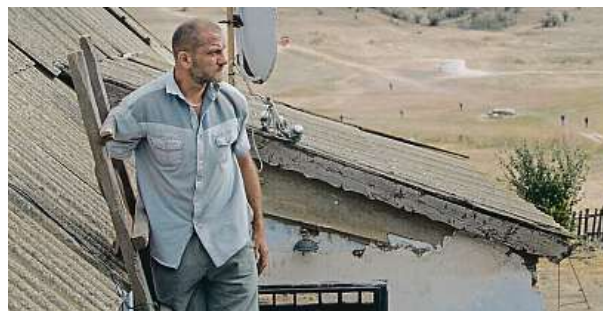
Snímek Klondike měl premiéru loni na filmovém festivalu Sundance, kde získal cenu za režii.

Nebudou chybět snímky pro děti, například animovaný film Titina, psí polárnice či Až přijde kocour. I letos festival promítne film z 35mm kopie, a to německý snímek Lásk na grilu, na diváky tak již