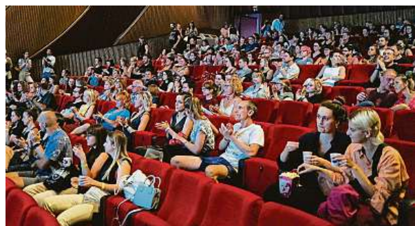
Do litoměřického Kina Máj se vejde 320 diváků. Na fotce je zahájení loňského ročníku festivalu.