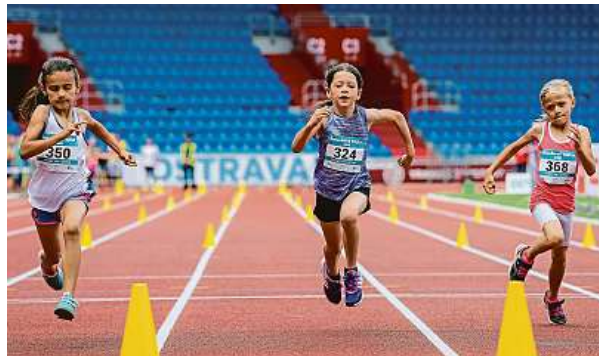
Děti, ale i dospělých, kteří by zvládli dlouhodobou fyzickou zátěž, v české populaci rok od roku ubývá.

Fyzická zdatnost naší populace není nic, nad čím bychom měli nutně jásat. V době, kdy máme téměř za humny válečný konflikt, jsou podobná zjištění varující. „Lidé se sice čím dál více obávají bezpečnostních rizik, ale jsou stále méně ochotní a schopní je řešit, nebo nevědí jak,“ říká Zdeněk Ertl ze Sdružení sportovních svazů