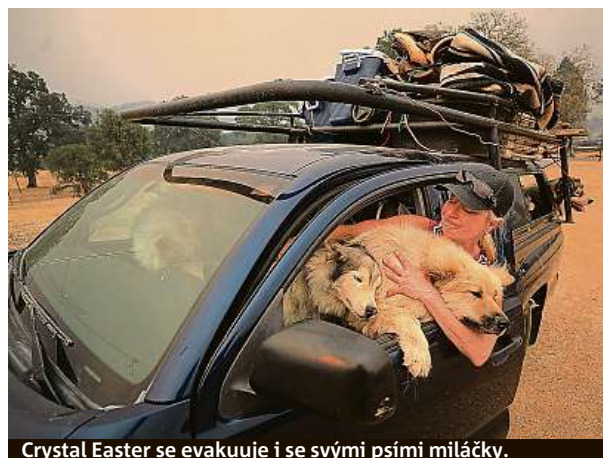
Crystal Easter se evakuuje i se svými psími miláčky.