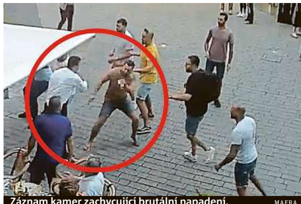
Záznam kamer zachycující brutální napadení.

O obvinění z pokusu o vraždu jako první informoval deník Právo. „Policie už provedla změnu právní kvalifikace,“