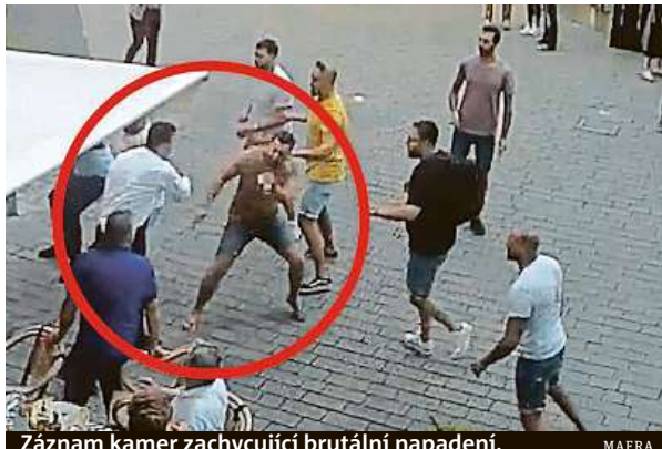
Záznam kamer zachycující brutální napadení.

O obvinění z pokusu o vraždu jako první informoval deník Právo. „Policie už provedla změnu právní kvalifikace,“