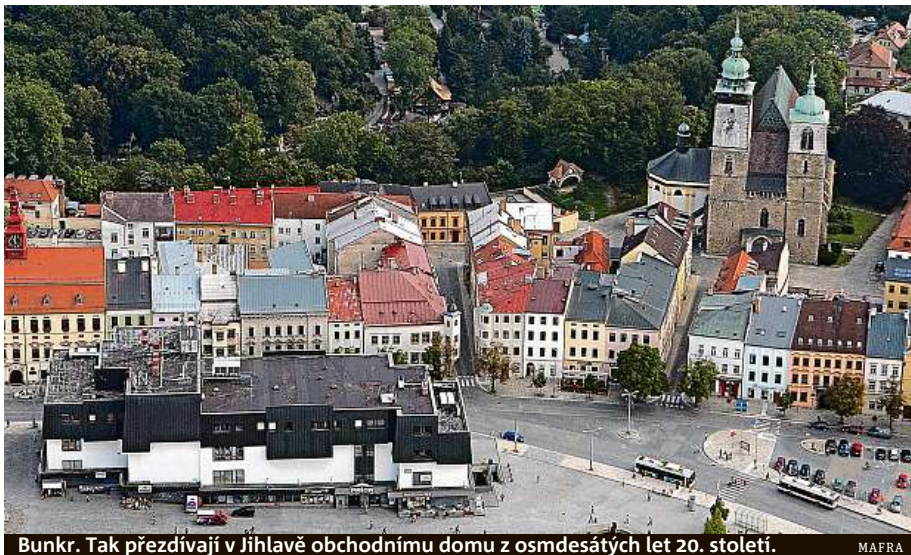
Bunkr. Tak přezdívali v Jihlavě obchodnímu domu z osmdesátých let 20. století.

Už mnoho let se proto nejen v Jihlavě ozývají hlasy, aby byl obchodní dům zbu-