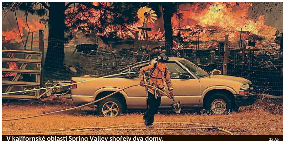
V kalifornské oblasti Spring Valley shořely dva domy.