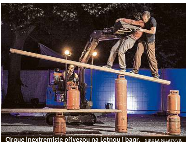
Cirque Inxtremiste přivezou na Letnou i bagr. NIKOLA MILATOVIC

V díle Bestias od Baro d'evil Cirk Cie zpestří vystoupení tanečníků, akrobatů i hudebníků také zvířata.