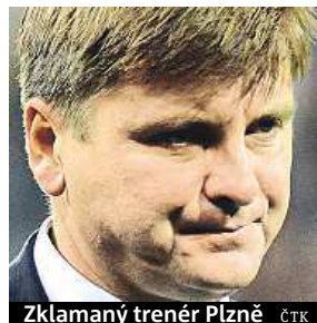
Zklamáný trenér Plzně

I fotbalisté Mladé Boleslavi v odvetě třetího předkola Evropské ligy podlehli Lyonu na jeho hřišti 1:2 a po úvodní domácí porážce 1:4 v soutěži