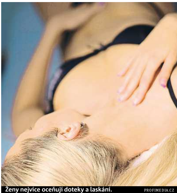
Ženy nejvíce oceňují doteky a laskání.