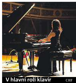
V hlavní roli klavír CHF