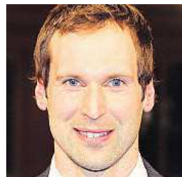
Kolik si vydělají čeští sportovci?