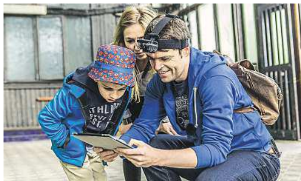
Hra je určena pro rodiny, ale i jednotlivce či skupiny. KS

Mobilní aplikace ve své informační části funguje jako průvodce bez ohledu na to, zda uživatel hry momentálně hraje, či nikoliv. Vodi své uživatele po zajímavých místech Ostravy, jako jsou Vítkovické pece, Muzeum techniky U6, Slezskostravský hrad, zoo, halda Ema a další. Oživuje minulost významných lokalit pomocí jednoduchých úkolů a napínavého animovaného komiksu. Je určena pro rodiny s dětmi, hrát ji však mohou i jednotlivci