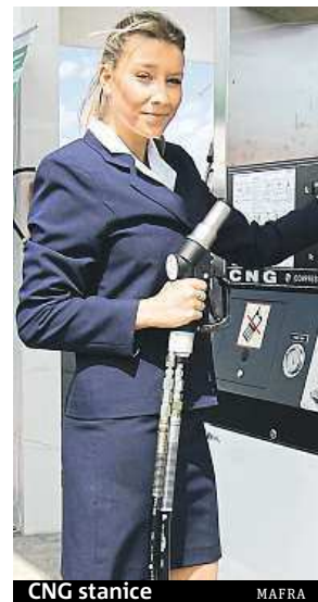
CNG stanice MAFRA

řízení se staví například v Příbrami, Plzni, Olomouci, Velkém Meziříčí nebo v Hradci Králové. „Celkově by tak do konce roku mohlo být u nás zhruba osmdesát CNG stanic,“ říká šéf Asociace NGV Zdeněk Prokopec. Podle odhadů by do šesti let mělo být v Česku asi 200 plnicích stanic, což by bylo srovnatelné s Rakouskem. BEL