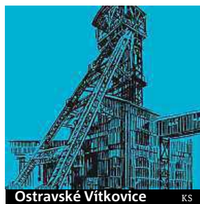
Ostravské Vítkovice KS