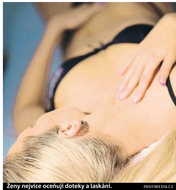
Ženy nejvíce oceňují doteky a laskání.

hodobé průzkumy Sexuologického ústavu 1. lékařské fakulty Univerzity Karlovy a Virohradské fakultní nemocnice. Podle nich orgasmus ob-