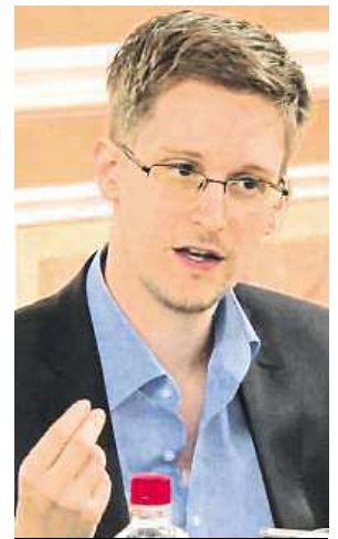
Edward Snowden

Snowden podle jeho právníka píljuje ruštinu a vede v Rusku „život skromného člověka“. O jeho bezpečnost se stará privátní