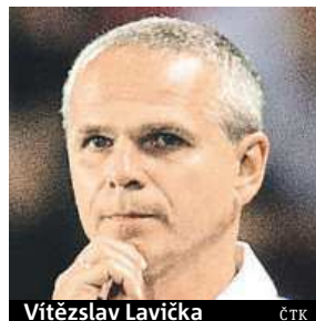
Vítězslav Lavička ČTK

Sparta tak přišla o možnost bojovat v závěrečném play-off o místo v základní skupině, kde se představila naposledy v roce 2005. Místo toho ji čeká 4. předkolo Evropské ligy.