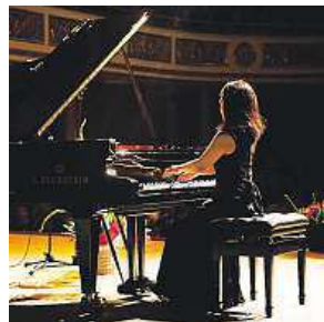
V hlavní roli klavír