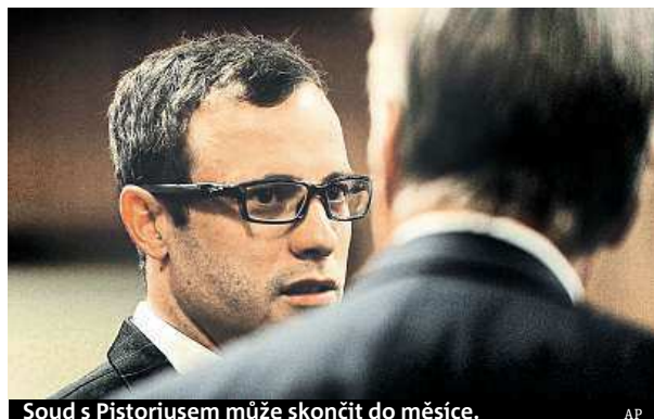
Soud s Pistoriusem může skončit do měsíce.

Za prohaného svědka označil handicapovaného atleta Oscara Pistoriuse, souzeného kvůli vraždě své přítelkyně, žalobce Gerrie Nel. Ve své závěrečné řeči prohlásil, že šestinásobný paralympijský vítěz napovídal soudu snůšku lží. Napadl rovněž atletovy právníky tvrzením, že používají dvě protichůdné verze obhajoby a měli by si vybrat. Podle Nela