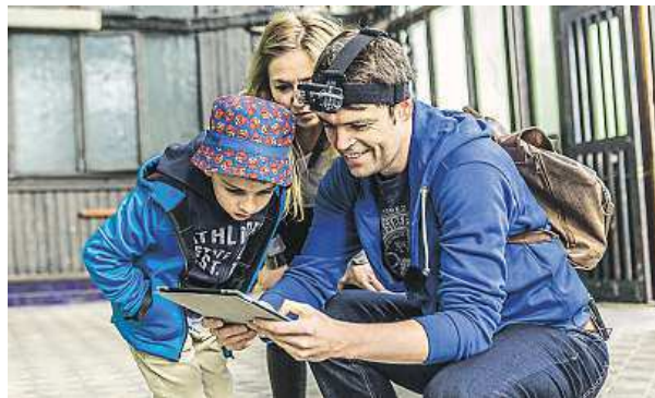
Hra je určena pro rodiny, ale i jednotlivce či skupiny.

Mobilní aplikace ve své informační části funguje jako průvodce bez ohledu na to, zda uživatel hry momentálně hraje, či nikoliv. Vodí své uživatele po zajímavých místech Ostravy, jako jsou Vítkovické pece, Muzeum techniky U6, Slezskoostravský hrad, zoo, halda Ema a další. Oživuje minulost významných lokalit pomocí jednoduchých úkolů a napínavého animovaného komiksu. Je určena pro rodiny s dětmi, hrát ji však mohou i jednotlivci