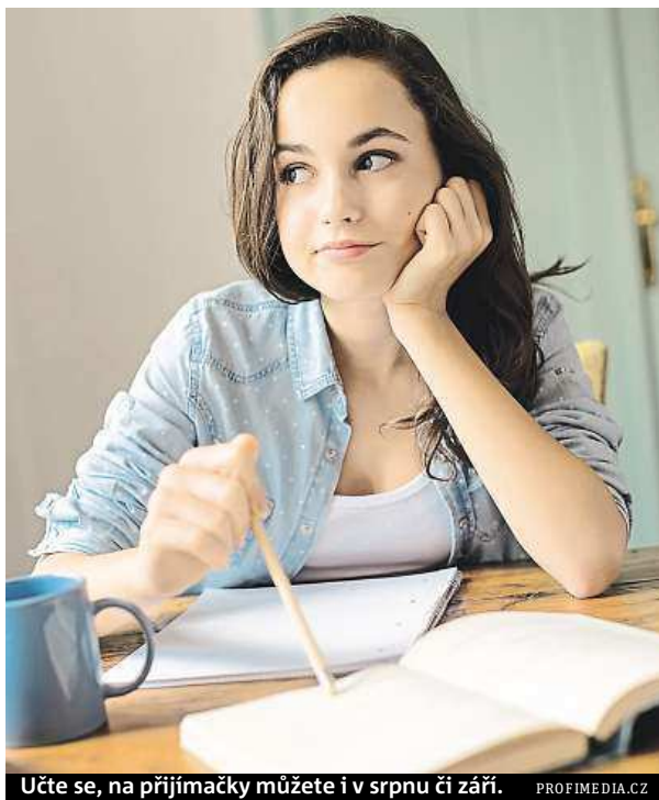
Učte se, na přijímačky můžete i v srpnu či září.

nových termínech nabízí i České vysoké učení technické v Praze. Aktuálně je zde možnost přihlásit se na elektrotechnickou fakultu, fakultu biomedicínského inženýrství či fakultu strojní.