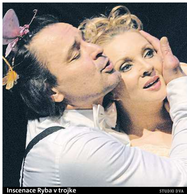
Inscenace Ryba v trojce