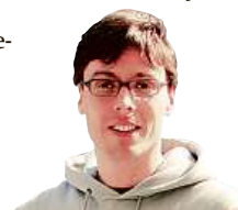
MARDOŠA ČLEN KAPELY TATA BOJS

někomu podaří a zjistí, že je jako první připraven vyrazit. Jeli-kož je ale jediný, rozhodne se dělat něco, čím by jen vyplnil čas... Pokud to má být jen pohodová dovolená bez zvláštních časových závazků (jako je třeba cesta na chalupu), není to zas takový problém. Když ale potřebujete například stihnout tra-jekt, který odjíždí z devět set kilometrů vzdáleného přístavu, mohou začít trochu pracovat nervy. Jste ještě doma, ale v hlavě vám už hučí siréna odjíždějícího plavidla... Pokud tedy nezůstáváte celé léto doma, kde je nejlíp, a jedete někam, kde je všude dobře, pře-ji, ať je to bez nervů!