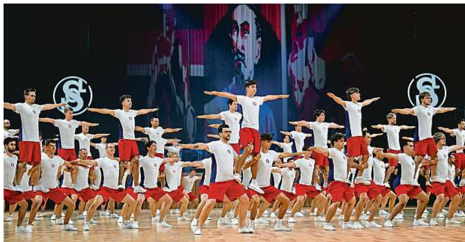
Přehlídka Sokol Gala, při níž stovky sokolů ztvárnily cestu České obce sokolské od založení po současnost.