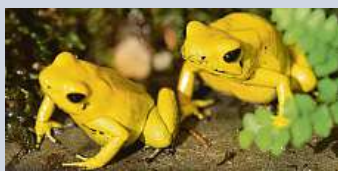
Vystaveno je 30 druhů žab.