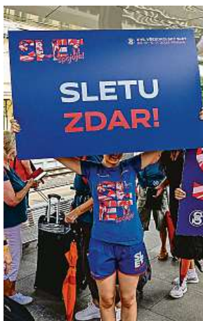
Metropole překypovala účastníky sletu.