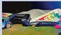
Vypukla panika. Při bouři padal na lidi stan.