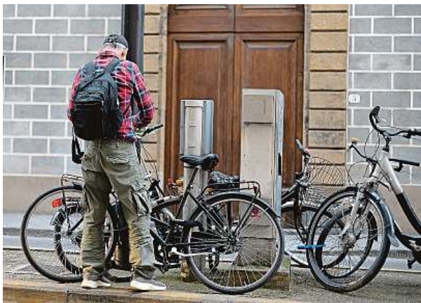
Odborníci doporučují k zabezpečení kola kombinaci několika bezpečnostních mechanismů.

Pojišťovny u nás se potýkají s touto kriminalitou také stále více. Atraktivní jsou hlavně dražší modely. „Fenoménem posledních let jsou krádeže kol z balkonů v horních patrech obytných domů ve městech, kdy se k nim zloděj spustí ze střechy. Dalším častým způsobem odcizení je odmontování z nosičů kol na vozidlech. Pro zloděje jsou samozřejmě nejdostupnější zadní nosiče za zavazadlovým prostorem, kterých stále