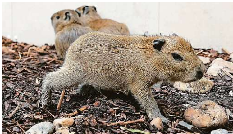
Mláďata vyrazila krátce po narození s rodiči do výběhu.