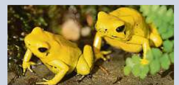
Vystaveno je 30 druhů žab.