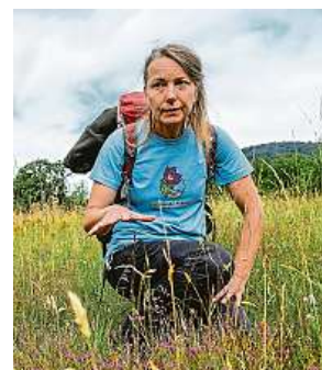
Sběr semen z louky u Srbské Kamenice