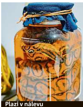
Plazi v nálevu

Mezi „delikatesami“, jež jsou v muzeu k vidění a ochutnání, je například koňak z pštrosích vajec, likér, který se vyrábí z bobřích pachových váčků, či rýžové víno, v němž se vaří mrtvolky malých myší až do té doby, než nápoj získá určitou příchuť rozkladu. „Musím uznat, že to rýžové víno chut-