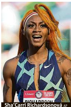
Sha'Carri Richardsonová

Americká atletická hvězda Sha'Carri Richardsonová se po kauze s marihuánou nezúčastní olympijských her ani jako členka štafety na 4 x 100 metrů. Jednadvacetiletou vycházející hvězdu nenominoval do Tokia národní atletický svaz. O individuální závod na stovce, do něhož se původně kvalifikovala jako vítězka