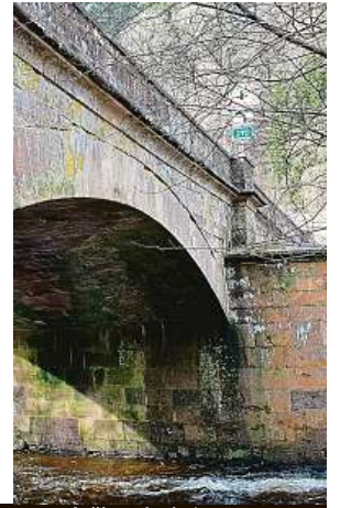
V Poniklé. V ČR je takových nenápadných staveb více. Ne všechny se podaří zachránit.

není památkově chráněný. Není v dobrém stavu, proto měl jít k zemi. Na jeho místě měl vyrůst most nový, betonový. „Podnikneme všechny potřebné kroky, aby se most podařilo zachránit v jeho původní podobě. V této souvis-