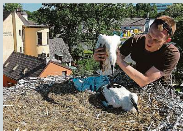
Při kontrole hnízda

Na západě Čech se letos po několika slabších letech zřejmě poměrně dobře vydařilo hnízdní sezona čápů bílých. Zhruba z osmi desítek sledovaných hnízd v Plzeňském a Karlovarském kraji je obsazeno kolem padesáti. „Na řadě z nich jsou letos