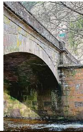
V Poniklé. V ČR je takových nenápadných staveb více. Ne všechny se podaří zachránit.

není památkově chráněný. Není v dobrém stavu, proto měl jít k zemi. Na jeho místě měl vyrůst most nový, betonový. „Podnikneme všechny potřebné kroky, aby se most podařilo zachránit v jeho původní podobě. V této souvis-