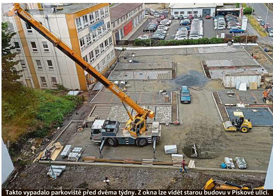
Takto vypadalo parkoviště před dvěma týdny. Z okna lze vidět starou budovu v Pískové ulici.