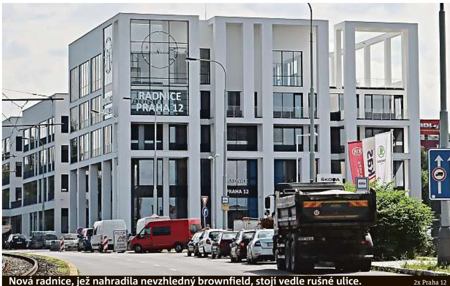
Nová radnice, jež nahradila nevzhledný brownfield, stojí vedle rušné ulice. 2x Praha 12

Některé obyvatele dvanácté městské části včerejší otevření radnice zmatlo. Slavnostní otevření totiž vedení