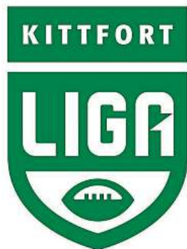
Ligové logo ARCHIV

V loňské sezoně prošla Vysočina Gladiators základní částí bez prohry. Jejich šanci