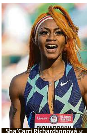
Sha'Carri Richardsonová

Americká atletická hvězda Sha'Carri Richardsonová se po kauze s marihuánou nezúčastní olympijských her ani jako členka štafety na 4 x 100 metrů. Jednadvacetiletou vycházející hvězdu nenominoval do Tokia národní atletický svaz. O individuální závod na stovce, do něhož se původně kvalifikovala jako vítězka