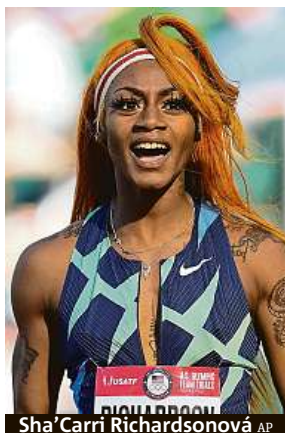
Sha'Carri Richardsonová

Americká atletická hvězda Sha'Carri Richardsonová se po kauze s marihuánou nezúčastní olympijských her ani jako členka štafety na 4 x 100 metrů. Jednadvacetiletou vycházející hvězdu nenominoval do Tokia národní atletický svaz. O individuální závod na stovce, do něhož se původně kvalifikovala jako vítězka