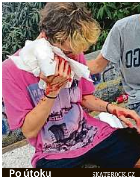
Po útoku SKATEROCK.CZ

Jaké konkrétní postupy policie zvolila, nechtěl s ohledem na probíhající vyšetřování přiblížit ani mluvčí české policie Jan Daněk. „Policisté se na tuto lokalitu více zaměří,“ sdělil krátce s tím, že naposledy tu policie byla před prázdninami v rámci celorepublikové akce HAD 2019 při které se zaměřila na opilé děti. „Pachatelům hrozí za výtržnictví dva roky, za ublížení na zdraví tři a například za loupež až deset let odnětí svobody. U mladistvých je pak sazba poloviční,“ uvedl k aktuálnímu problému na Stalini Daněk.