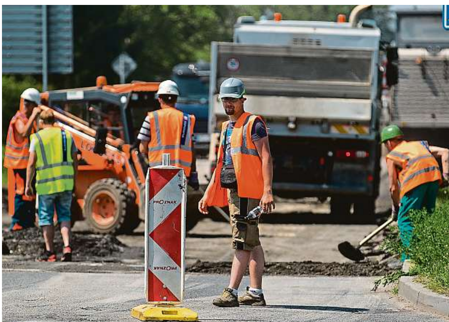
Opravy Vídeňské ulice mají pokračovat až do konce září.

„Když jsem chtěl z práce jet automobilem do svého bydliště, v době okolo osmnácté hodiny večerní, stála u zákazu hlídka příslušníků policie. Ti mi dali velmi hrubě najevo, doslova mi nadávali, že jsem asi úplně slepý a hloupý, že do daného místa nesmím. I když jsem jim v dokladech ukázal, kde se mé bydliště nachází, do oblasti mě nepustili,“ stěžuje si čte-