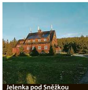
Jelenka pod Sněžkou

Cesta vede z náměstí po zelené kolem Žacléřského hradu. Ten je ale dlouhá léta ne-