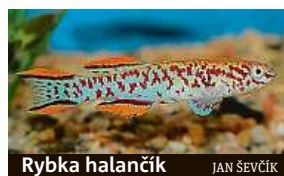
Rybka halančik JAN ŠEVČÍK

O jedné z nejkrásnější zbarvených akvarijních ryb, halančících, je známo, že dokáže dospět v neuvěřitelných 14 dnech. Nyní se díky mezinárodnímu týmu, v němž nechyběl Čech Martin Reichard ukázalo, že jikry halančičků jsou extrémně odolné: dokážou přežít průchod zaživacím traktem labutí rodu koskoroba. „Halančici tak mohou kolonizovat oblasti,