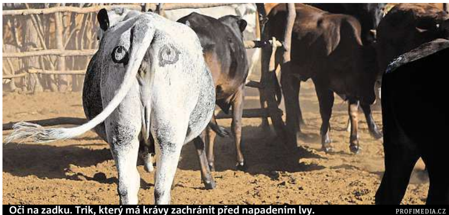
Oči na zadku. Trič, který má krávy zachránit před napadením lvy.

„Jde o to, abychom je zmátli a odradili od lovu,“ uvedl ochranář a biolog Jordan. „Vy-