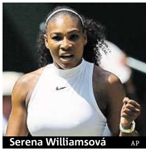
Serena Williamsová

V semifinále ženské čtyřhry bude mít zastoupení také český tenis. Karolína Plíšková totiž po boku Němky Julie Görgesové porazila fran-