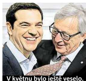
V květnu bylo ještě veselo.

Nejde jen o peníze. Evropa si odchod Řecka z eurozóny, takzvaný grexit, nemůže dovolit kvůli jednotě. Ta se teď hledá.