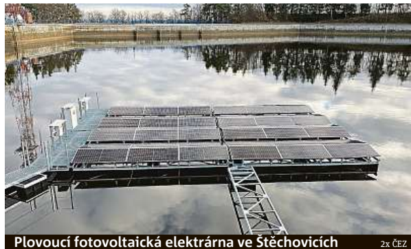
Plovoucí fotovoltaická elektrárna ve Stěchovicích

U překonávání milníků ještě zůstaňme. ČEZ totiž loni postavil 110 elektromobilních stanic. Dosud rekordní rok 2020 připsal 82 stanic. Na výborném vysvědčení se po-