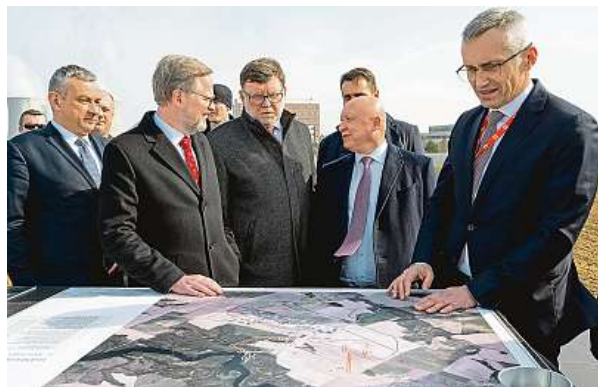
Vláda v březnu ohlásila spuštění tendru v Dukovanech.

Stavba nového jaderného zdroje navíc není hudbou vzdálené budoucnosti. V květnu ČEZ, respektive jeho sto procentní dceřiná společnost Elektrárna Dukovany II, zahájil výběrové řízení na dodavatele nového bloku. Do tendru se přihlásili tři uchazeči – americký Westinghouse, francouzská EdF a korejská společnost KHNP. Ti předložili do konce listopadu letošního roku úvodní nabídky. „Hlavním cílem je bezpečný a eko-