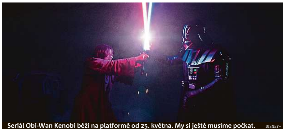
Seriál Obi-Wan Kenobi běží na platformě od 25. května. My si ještě musíme počkat. DISNEY+

Kromě početné kompletní knihovny všech marvelovek, Star Wars a také klasických disneyovských pohádek se mohou uživatelé těšit i na na-