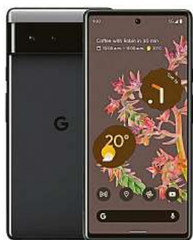
Google Pixel 6 MIRONET