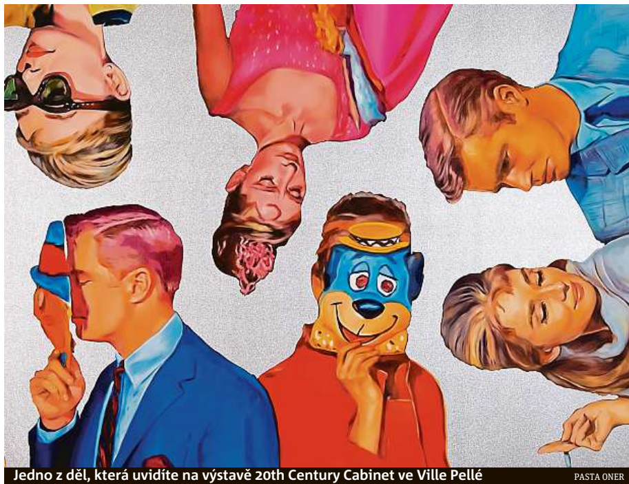
Jedno z děl, která uvidíte na výstavě 20th Century Cabinet ve Ville Pellé