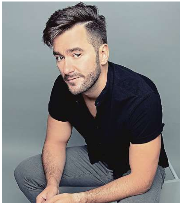
Marek Ztracený vydává nové album.