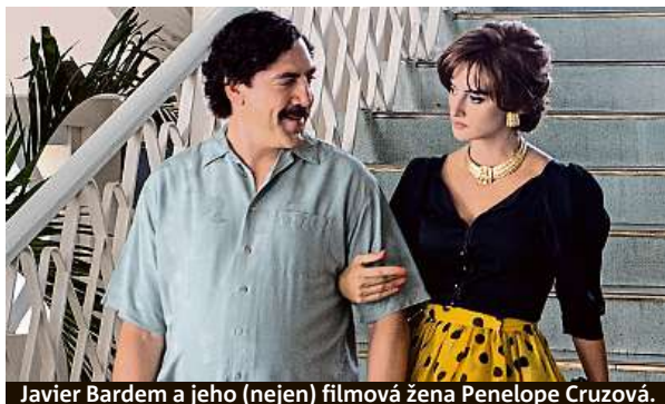
Javier Bardem a jeho (nejen) filmová žena Penelope Cruzová.

Je to úplně jiné než hrát psychopata. Například Anton Chigurh ze snímku Tahle země není pro starý je psychopat. Nezájímá se o jakékoliv emoce a to ho dělá děsivým, velmi děsivým a nebezpečným. Ale myslím, že člověk, který je empatický, miluje a zároveň dělá špatné věci, je ještě děsivější a mnohem nebezpečnější.