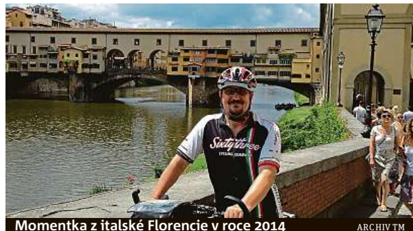
Momentka z italské Florencie v roce 2014

Do Atén chtěl Tomáš původně vyrazit už loni, ale odradila ho silná migrační vlna, která se valila právě přes Řecko dál co centra Evropy. Letos