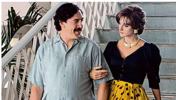
Javier Bardem a jeho (nejen) filmová žena Penelope Cruzová.

Je to úplně jiné než hrát psychopata. Například Anton Chigurh ze snímku Tahle země není pro starý je psychopat. Nezajímá se o jakékoli emoce a to ho dělá děsivým, velmi děsivým a nebezpečným. Ale myslím, že člověk, který je empatický, miluje a zároveň dělá špatné věci, je ještě děsivější a mnohem nebezpečnější.