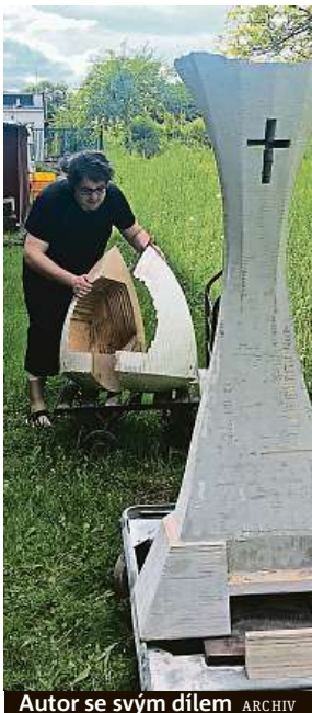
Autor se svým dílem

Před tisíci lety tam prožil dětství svatý Václav, dnes patří budečské hradiště na Kladensku modernímu umění.