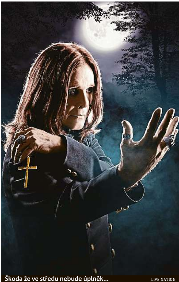
Škoda že ve středu nebude úplněk...