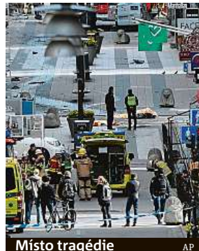
Místo tragédie

Stoupenec organizace Islámský stát (IS), jemuž bylo v době útoku 39 let, se již dříve v činu přiznal. Uvedl, že chtěl potrestat Švédsko za účast v mezinárodní koalici proti Islámskému státu.