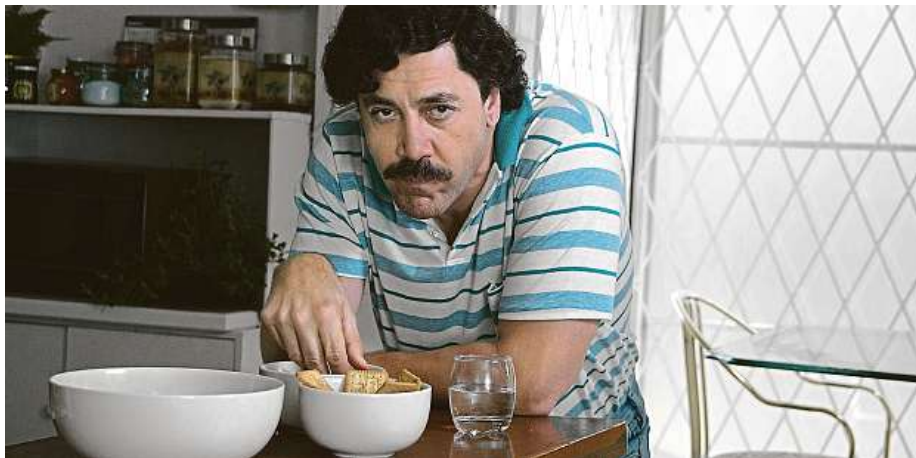
Escobar vypadá jako hodný strejda. Ve skutečnosti jde o nelítostného vraha.

Herecký a manželský pár dohromady Bardem – Cruzová filmu těžce dominuje. Evidentně jim to doma klapě, takže si mohou dovolit natočit další společný projekt. První jmenovaný úspěchu snímku věřil natolik, že do něj investoval peníze i čas jako producent. Do svého portrétu Pabla Escobara pak vložil jeho typickou syrovou, až maniackální ži-