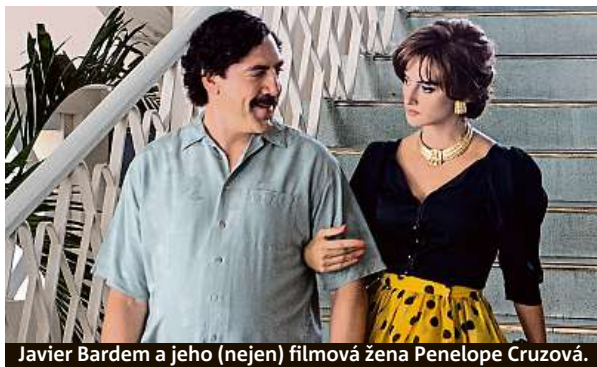
Javier Bardem a jeho (nejen) filmová žena Penelope Cruzová.

Je to úplně jiné než hrát psychopata. Například Anton Chigurh ze snímku Tahle země není pro starý je psychopat. Nezájímá se o jakékoli emoce a to ho dělá děsivým, velmi děsivým a nebezpečným. Ale myslím, že člověk, který je empatický, miluje a zároveň dělá špatné věci, je ještě děsivější a mnohem nebezpečnější.