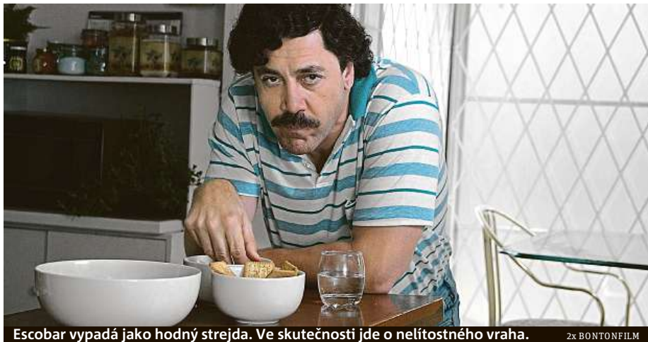
Escobar vypadá jako hodný strejda. Ve skutečnosti jde o nelítostného vraha.

Herecký a manželský pár dohromady Bardem – Cruzová filmu těžce dominuje. Evidentně jim to doma klapě, takže si mohou dovolit natočit další společný projekt. První jmenovaný úspěchu snímku věřil natolik, že do něj investoval peníze i čas jako producent. Do svého portrétu Pabla Escobara pak vložil jeho typickou syrovou, až maniackální ži-