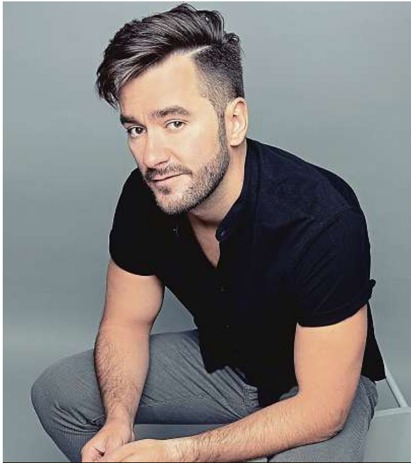
Marek Ztracený vydává nové album.