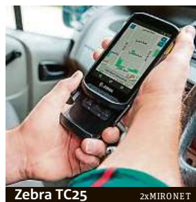
Zebra TC25 2xMIRONET

Důležitým prvkem výbavy je čtečka čárových kódů – bleskově přečte elektronické i tiš-