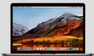
MacBook Pro 13" 128GB - 30 990 Kč

Mimořádné slevy, soutěž o iPhone 8 a navíc vše na splátky bez navýšení.