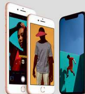
12% sleva na iPhone 7, 8 a X

Kompletní přehled slev na: www.istores.cz/Flora Atrium Flora Praha