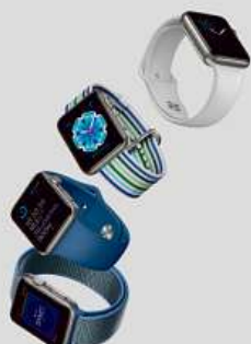
10% sleva na Apple Watch