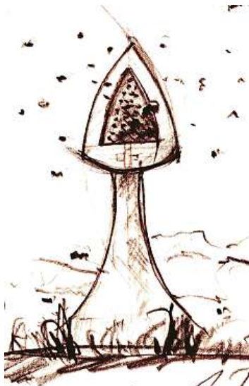
Skica božích muk NEOLOKATOR.CZ

Pod vedením charizmatického ředitele ústavu docenta Jiřího Kolíška jsme odlili a odformovali oba dva díly z betonu UHPC (Ultra high performance concrete). Výsledek je dechberoucí a rád se o něj podělím na webu www.neozahrada.cz .