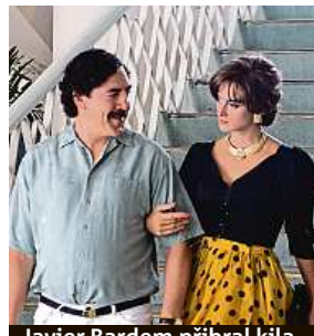
Javier Bardem přibral kila.

Měl rodinu a děti, ale nejdůležitější byly oběti a rodiny obětí. Pobyt v Kolumbii nás inspiroval, protože jsme byli obklopeni lidmi, kteří příběh znali a byli jeho součástí. Vytvořil jsem také pojitko mezi ním a jeho oblíbeným zvířetem. Dává to smysl, protože