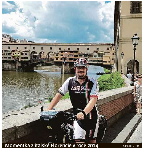
Momentka z italské Florencie v roce 2014