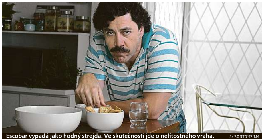
Escobar vypadá jako hodný strejda. Ve skutečnosti jde o nelítostného vraha.

Herecký a manželský pár dohromady Bardem – Cruzová filmu těžce dominuje. Evidentně jim to doma klapne, takže si mohou dovolit natočit další společný projekt. První jmenovaný úspěchu snímku věřil natolik, že do něj investoval peníze i čas jako producent. Do svého portrétu Pabla Escobara pak vložil jeho typickou syrovou, až maniackální ži-