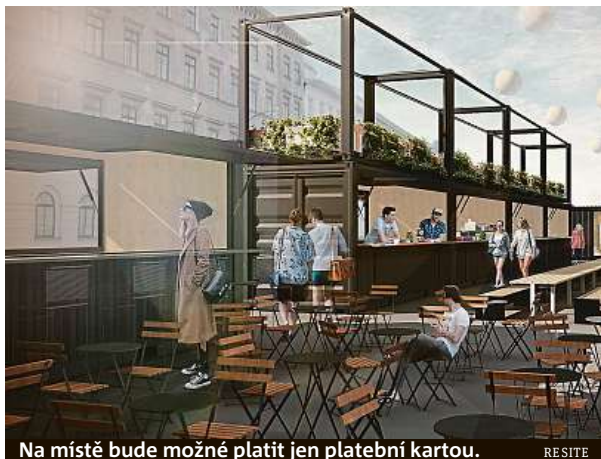
Na místě bude možné platit jen platební kartou. RESITE

Tržiště složené z dvaceti velkých přepravníků vzniklo u Masarykova nádraží.