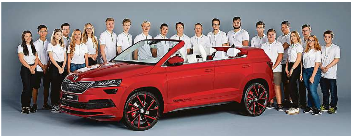
Osm měsíců pracovali žáci mladoboleslavského podnikového učiliště na proměně Škody Karoq v unikátní kabriolet. ŠKODA AUTO

Klienti hazardují. Netuší, že by internetové bankovníctví neměli řešit z veřejných sítí. Hackeri. Dokážou si zkopírovat i otisk prstu nebo sken oka. Mladí. Peníze už posílají hlavně přes chytré telefony STRANA 10