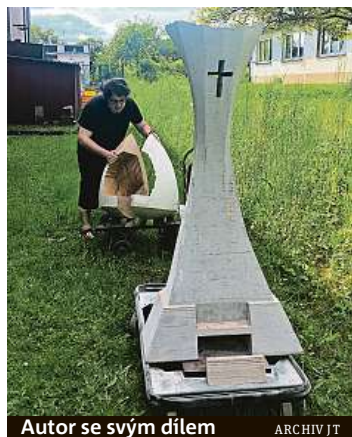
Autor se svým dílem

Nejsem čistokrevný sochař, takže jsem volil možná zbytečně složitý proces výroby. Použil jsem 3D frézování a tisk, kdy základní kopyto určené k výrobě hlavy a patky muk bylo složeno z dřevěných plátů, kde tvar je generován počítačovým softwarem podle požadavků přímo od hmyzu. Po hrubém opracování jsme od ledna v sádrařské dílně Akademie výtvarných umění v Praze vyráběli formy z laminátu a kovu. Poslední výrobní krok proběhl tento týden.