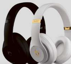
35% sleva na Beats sluchátka a reproduktory