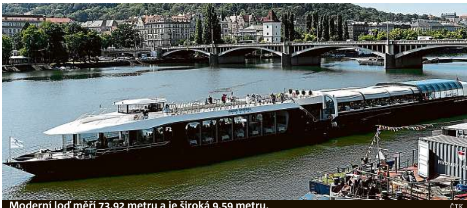
Moderní loď měří 73,92 metru a je široká 9,59 metru.

Přes pět set lidí se může vydat městem komfortním plavidlem rychlostí až 20 kilometrů za hodinu.